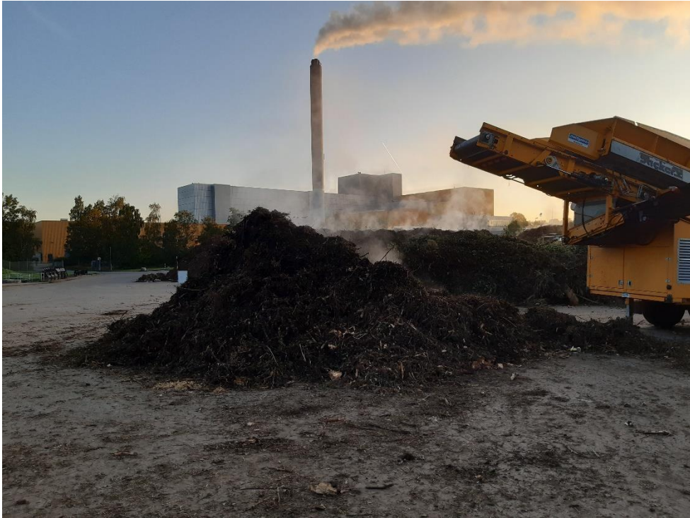
Den grove fraktion fra 1. sortering og neddeling (Biobrændsel)