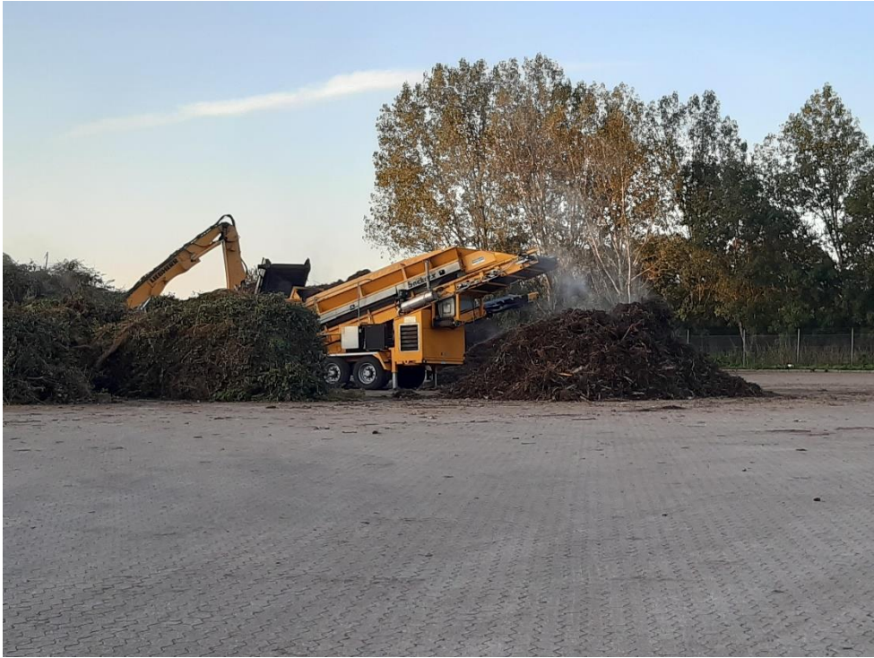
Neddelings- og sorteringsanlæg