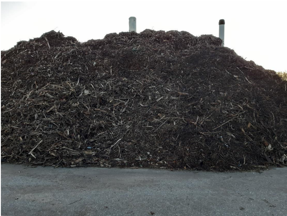
Biobrændsel klar til afhentning