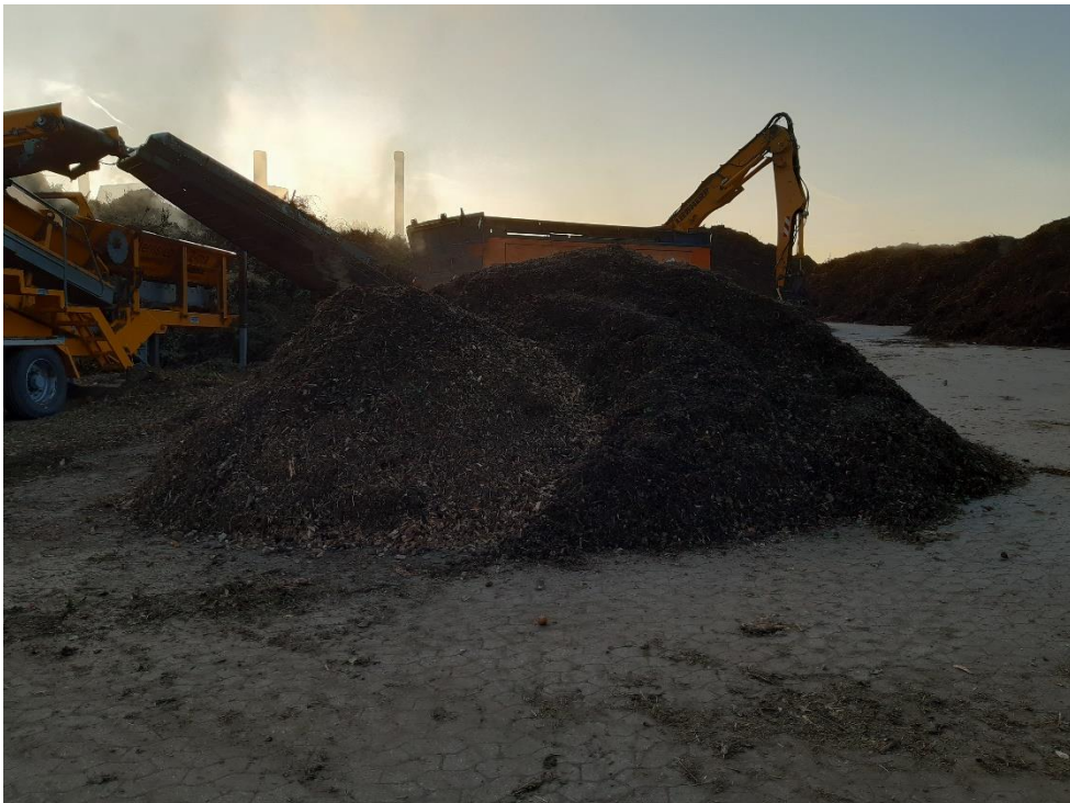
Den fine fraktion (råkompost)