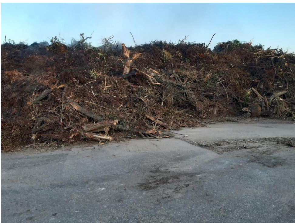
Ikke neddelt og sorteret have- og parkaffald

LFN oplyste, at det pt ligger 1.800 tons neddelt til biobrændsel og antageligt 100 tons råkompost (en mindre bunke). LFN oplyser, at der er dokumentation for, hvor meget oplag, der er på pladsen. Blev ikke efterspurgt på tilsynet.