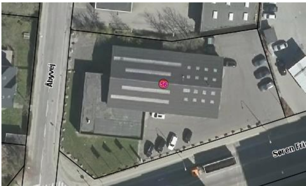
Luftfoto af virksomheden med matrikelskel, anno 2019

I forhold til kommuneplanen ligger virksomheden i I forhold til kommuneplanen ligger virksomheden i erhvervsområdet 160403ER. Nærmeste boliger ligger vest for virksomheden ud mod Åbyvej se nedenstående luftfoto.