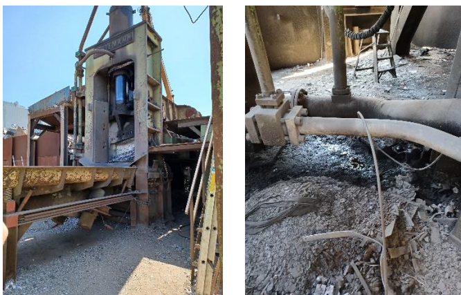
Saks samt spild af hydraulikolie under.