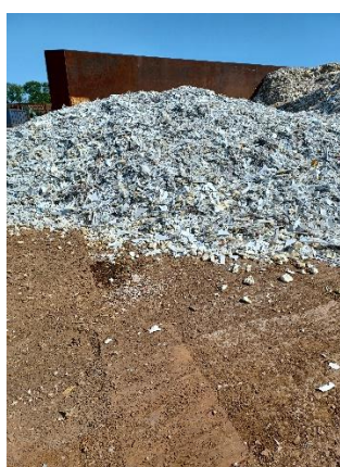
Affald uden for bås.

Der blev ligeledes observeret affald uden for båsene – både ud på køreareal og på ubefæstet areal bag båsene og på den østlige side af kajen. Det er problematisk, da affaldet kan blive kørt ned i jorden eller der er længerevarende oplag på ubefæstet areal. Det indskræpes at affald skal holdes inden for de dertil indrettede bås/områder – indskræpelse fremsendes særskilt.