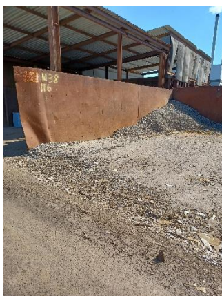
Belægning slidt mellem bås og køreareal.