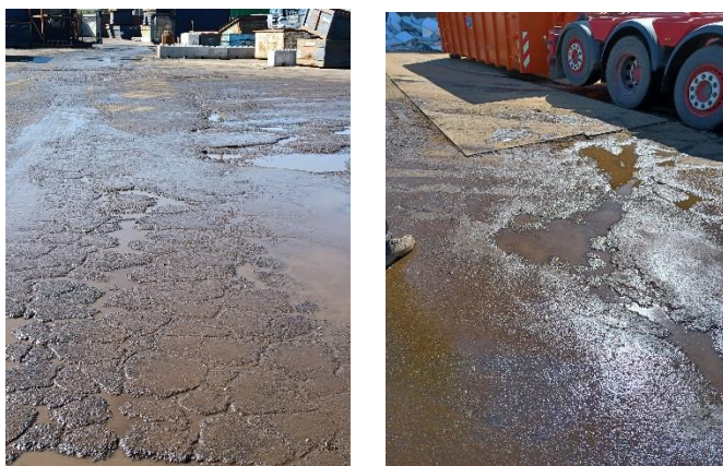
Eksempel på belægning – billede af areal ved metalhal samt køleskabsshredder.

Der er særligt slid i sving på vejen pga. tung trafik samt ved aflæsning foran køleskabs-shredderen. Ifølge produktionsdirektør var der bestilt reparation af belægning i svinget på vejen for enden af kanalen. Desuden blev det oplyst, at belægning ved aflæsning af køleskabe under udlagte jernplader var ok. Der var enighed om, at arbejdsområdet ved denne aktivitet er større end udlægget af jernplader. Belægningen rundt om er i meget dårlig stand og skal repareres på et areal svarende til lastbil + container og plader lægges efterfølgende på for holdbarhed. I metalgården var der et hul i belægningen ca. midt på pladsen. I hjørnet ved spånhal blev der også observeret et hul i belægning, hvor der stod vand.