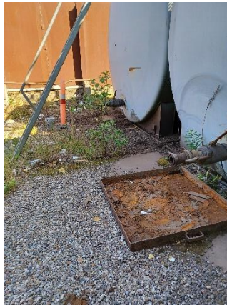
Klodser ved spånoliehal samt spånolietanke.

Tankgård bag spånolietankene: Tankgården blev tidligere brugt til rensning af oliefiltre. Oprydning i gang, så gården kan rengøres. Spånolietankene flyttes evt. hertil efterfølgende. Hvis tankgården skal bruges, skal der foretages kontrol af tæthed eller sløjfning af pumpebrønd. Der var fjernet to tanke fra dette område i forbindelse med oprydningen.