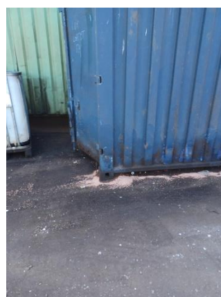
Spildolietank ved køleskabshredder, hvor der har være spild.

Saksen og jordforurening herved blev besigtiget. Der står en tank til hydraulikolie på 10.000 liter i pumpehus samt en palletank under saksen. Der var et mindre oliespild under saksen, som skal suges op. Belægningen er jf. virksomheden lavet inden maskinen blev sat op. Svar på påbud om yderligere undersøgelser ved saksen er endnu ikke indsendt til Miljøstyrelsen. Fristen var ulitmo marts 2023.