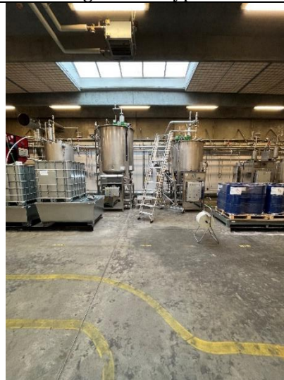
Produktionsafsnit (ikke i drift)