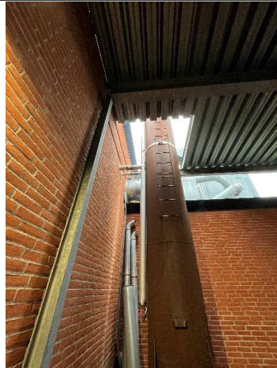
Skorsten (7 m)