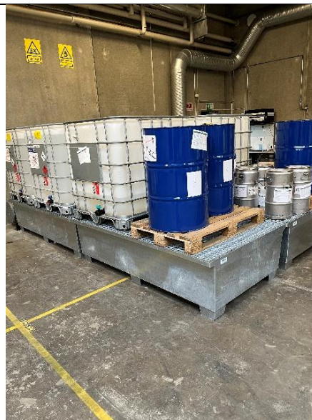
Mellemlager med drypbakker