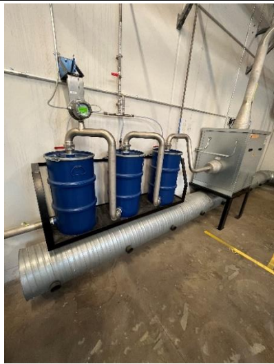
Luftrensning (3 kulfiltre)