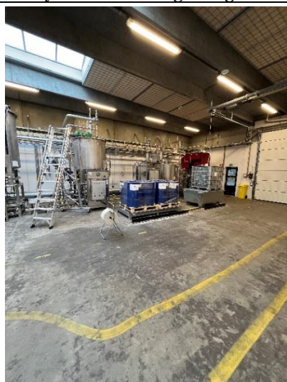
Produktionsafsnit (ikke i drift)