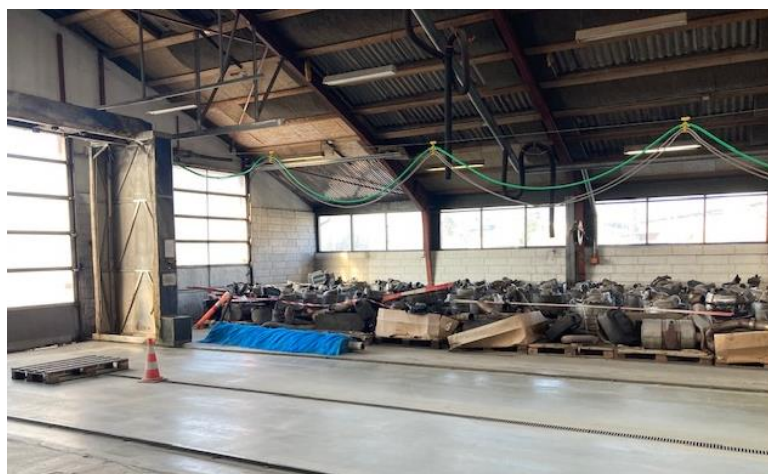
Figur 4: Oplag af brugte partikelfiltre i vaskehal (tilsyn 2022)