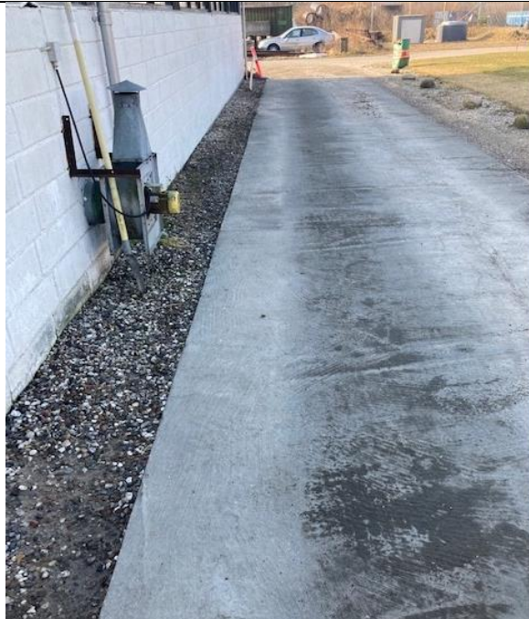
Figur 6: Kørevej på bagsiden af vaskehal, hvor nedgravet spildolietank er fjernet (tilsyn 2022)