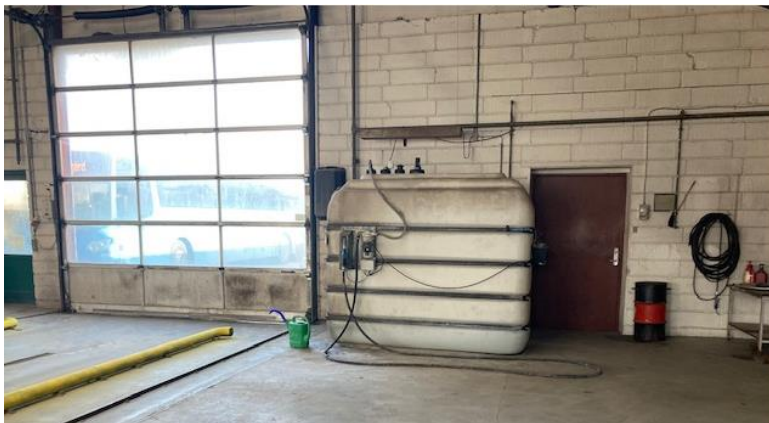
Figur 1: 3000 liters tank til AdBlue (tilsyn 2022)

Tanken er placeret i vaskehallen indenfor portåbning, hvor der er afløb til sandfang og olieudskiller. Tanken er sikret mod påkørsel via "liggende pullerter".