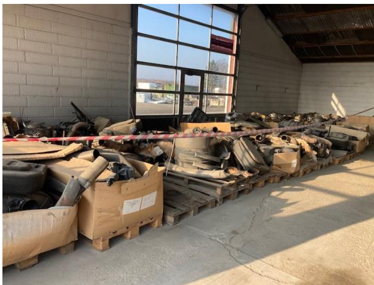
Figur 3: Oplag af brugte partikelfiltre i tidligere værkstedshal (tilsyn 2022)

Filtrene var oplagret i den tidligere værkstedshal samt i vaskehallen.