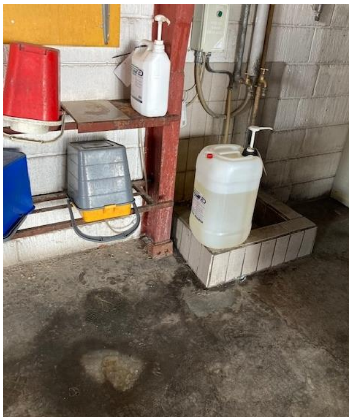
Figur 2: Synligt spild på belægning, hvor der opbevares og benyttes sæber (tilsyn 2022)

Der blev observeret spild i den tidligere værkstedshal, hvor sæber til vask af bussernes vinduer og gulve opbevares og benyttes. I hallen er der støbt beton-gulv med afløb, hvor der er opkant omkring. Dog opbevares sæber på opkanten til afløbet.