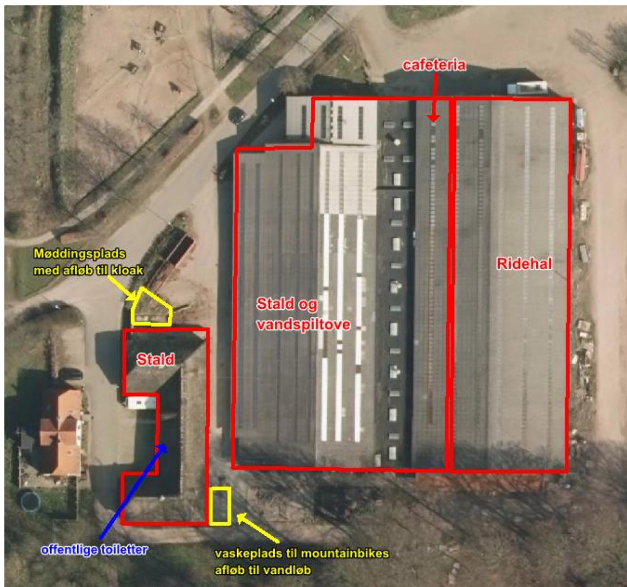
Figur 2. Rideskolens bygninger og anlæg