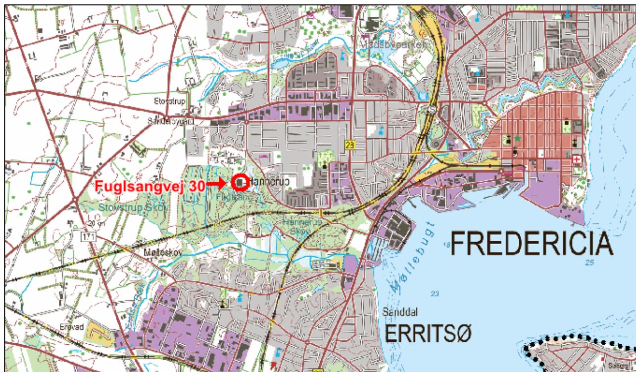
Figur 1. Husdyrbrugets beliggenhed

Husdyrbruget er beliggende sydvest for Fredericia By. Beliggenheden fremgår af Figur 1.