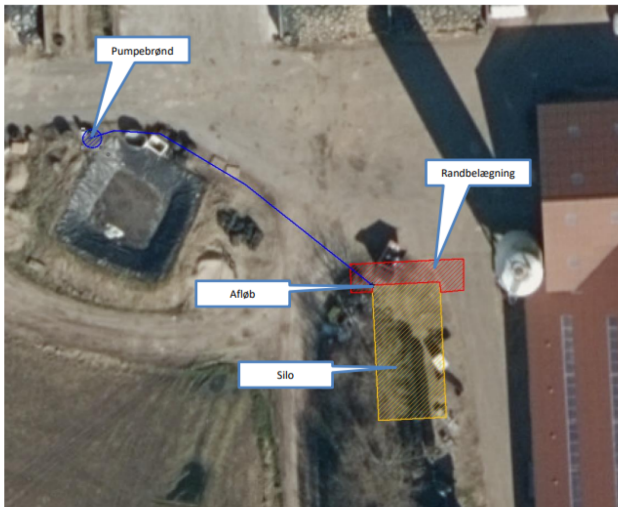
Figur 1 Placering af silo, randbelægning og afskærmende beplantning, samt placering af afløb og rør til pumpebrønden ved den eksisterende silo.

Ansøger vil opføre en ny ensilagesilo på ca. 6 x 12 m med ca. 1,5 m høje betonsider m høje sider. Siloen placeres vest for stalden ca. 4 m fra ejendommens gastætte kornsilo.