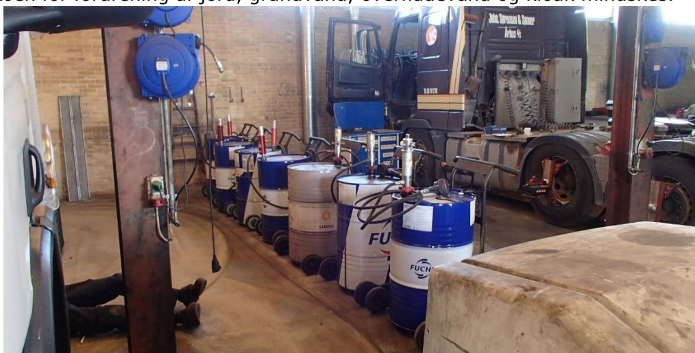
Billede af placeringen af olietromlerne i værkstedet

Tromler med hydraulik- og gearolie blev tidligere opbevaret tæt ved porten. For at leve op til Autoværkstedsbekendtgørelsen, er tromlerne flytte længere ind i værkstedet, hvorved risikoen for forurening af jord, grundvand, overfladevand og kloak mindskes.