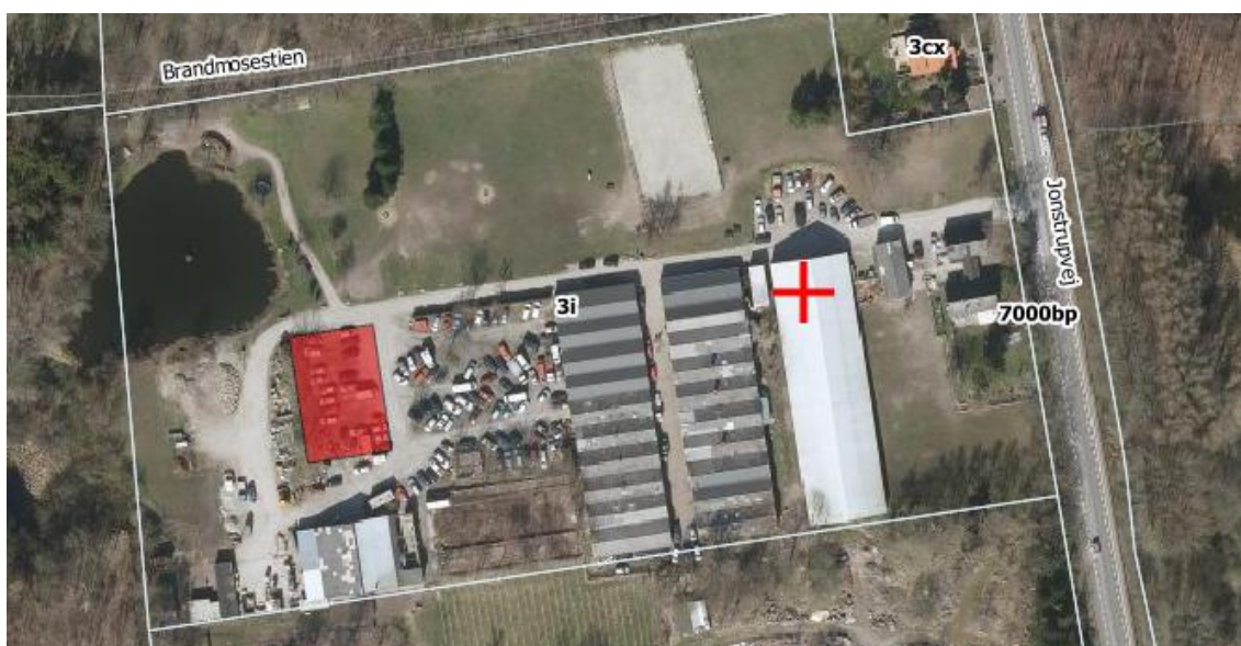
Figur 2: Oversigtskort over ejendommen, rødskravering angiver V2-kortlagt areal.

Et mindre areal er kortlagt på vidensniveau 2, se nedenstående figur 2.