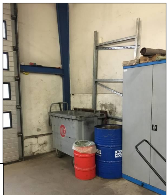
Foto af venstre side af værkstedshallen, hvor container til affald er placeret lige inden for porten. Desuden står tromle til andet affald. Kemikalieskabet ses ved siden af.

Oliefiltre og bremseklodser samles i kasser og afleveres på genbrugspladsen i Lystrup.