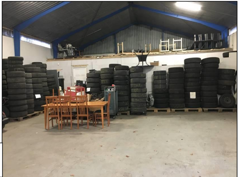
Foto af lagerhal, hvor der blandt andet opbevares dæk. Spildolietanken står også i lagerdelen nærmest værkstedsindgangen/porten.

Værkstedshal opvarmes med varmempumpe. Lagerhal er uopvarmet.