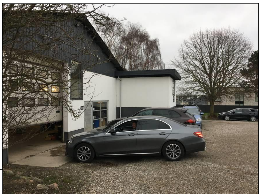
Foto af indkørsel til værkstedet. Her er det en udlejningsbil der køres ind

Det vurderes, at støjgrænserne er overholdt.