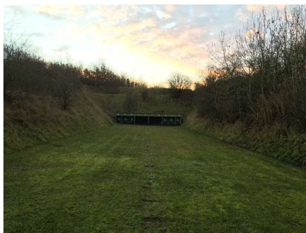
50 meter riffelbane