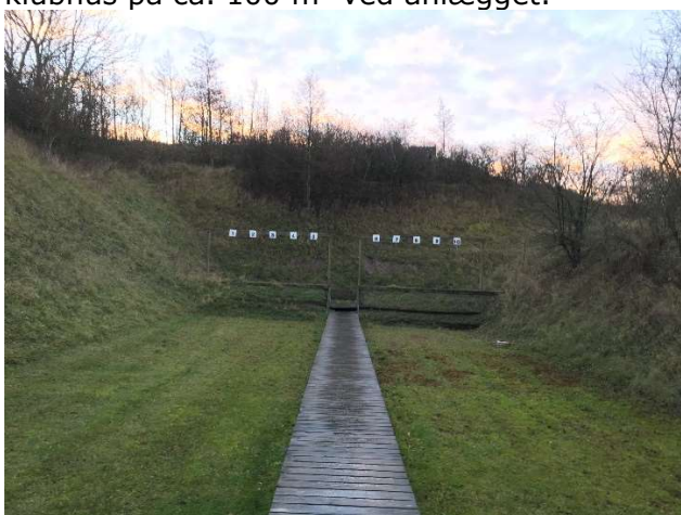
25 meter pistolbane

Skydebaneanlægget består af 3 skydebaner på henholdsvis 25 m, 50 m og 167 m. Der er et klubhus på ca. 100 m 2 ved anlægget.