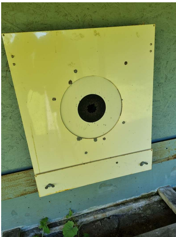
Kuglefang ved 50 meter banen.