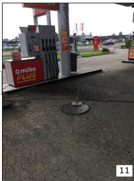
Foto 11 viser belægning med SF-sten mellem benzinstanderne. Desuden ses olieudskillerbrønd, der også ses af foto 7 og 8.

Under belægningsudskiftningen undersøges der for olieforurening og det oplyses, at Teknik og Miljø kontaktes inden projektet, sættes i gang.