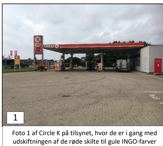
Foto 1 af Circle K på tilsynet, hvor de er i gang med udskiftningen af de røde skilte til gule INGO-farver

Brændstofstation med fire standere og tilknyttet vaskehal. Virksomheden Circle K overgår fra bemanded station med kiosk, til ubemandet station (INGO) med kontrolbesøg.