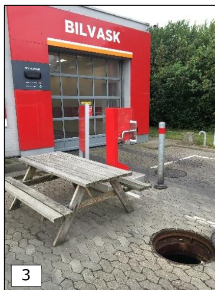
Foto 2 og 3 af vaskehallen med opkørselsareal og kig til olieudskiller (se foto 6)