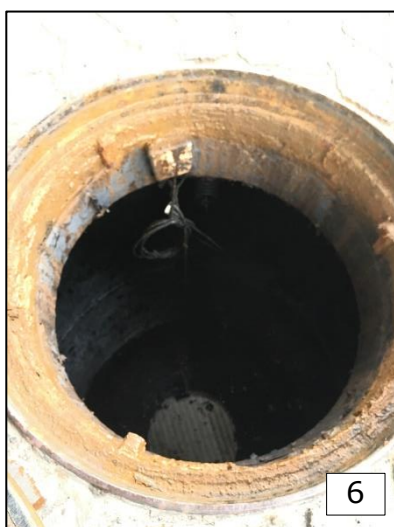
Foto 6-8 af olieudskillerbrønd med føler fra tilsynet