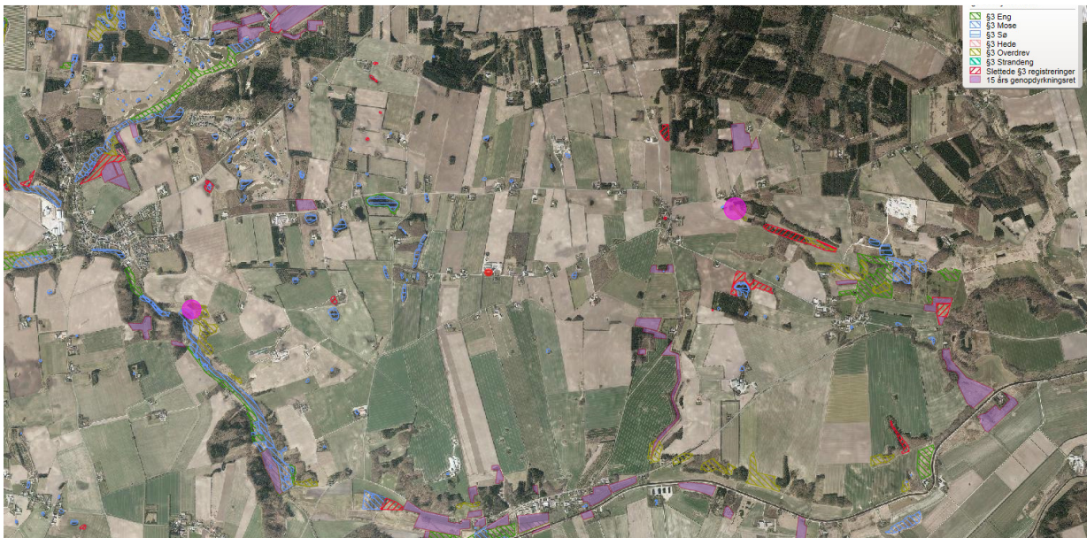
Kategori 3 natur, hvortil der er beregnet ammoniakdeposition er angivet med pink cirkel.

Lige nord/nordøst for anlægget ligger en skov, der er registreret som værende potentiel ammoniakfølsom. Skoven er opført efter 1999 og der er tale om skov plantet i rækker. På grund af skovens alder og udseende som plantage, vurderes denne ikke at være ammoniakfølsom. Nærmeste skov (formentlig en gammel bøgeskov), der kan være ammoniakfølsom, ligger ca. 850 meter vest for anlægget. Der er beregnet en merdeposition herpå på 0,2 kg N/ha/år.