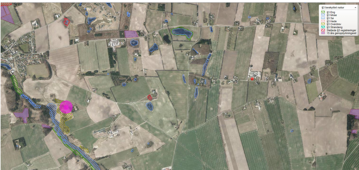
Nærmeste kategori 2-natur er markeret med pink cirkel. Anlægget er angivet med rød markering.

Kategori 2-natur udgøres af ammoniakfølsomme områder udenfor Natura 2000-områder, nærmere bestemt højmoser, lobeliesøer samt heder større end 10 ha, som er omfattet af naturbeskyttelseslovens § 3, og overdrev større end 2,5 ha, som er omfattet af naturbeskyttelseslovens § 3. Nærmeste kategori 2 natur er et overdrev beliggende 2,5 km vest/sydvest for ejendommen. Der er beregnet en totaldeposition herpå på 0,0 kg N/ha/år. Beskyttelsesniveauet er dermed overholdt.