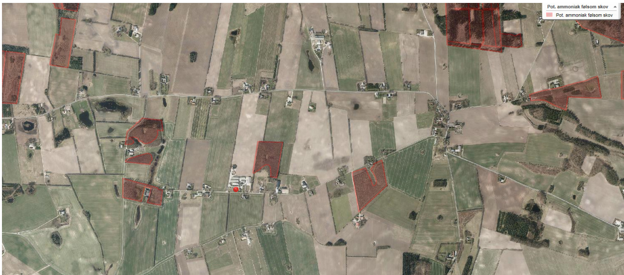
Kortet viser potentielt ammoniakfølsomme skove

Lige nord/nordøst for anlægget ligger en skov, der er registreret som værende potentiel ammoniakfølsom. Skoven er opført efter 1999 og der er tale om skov plantet i rækker. På grund af skovens alder og udseende som plantage, vurderes denne ikke at være ammoniakfølsom. Nærmeste skov (formentlig en gammel bøgeskov), der kan være ammoniakfølsom, ligger ca. 850 meter vest for anlægget. Der er beregnet en merdeposition herpå på 0,2 kg N/ha/år.