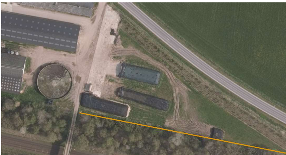
Beskyttet dige markeret med orange streg.

Ensilagesiloerne skal placeres mindst 2 meter fra det beskyttede dige som er vist nedenfor. Diget må ikke beskadiges eller dækkes til med jord under etableringen af ensilagesiloer.