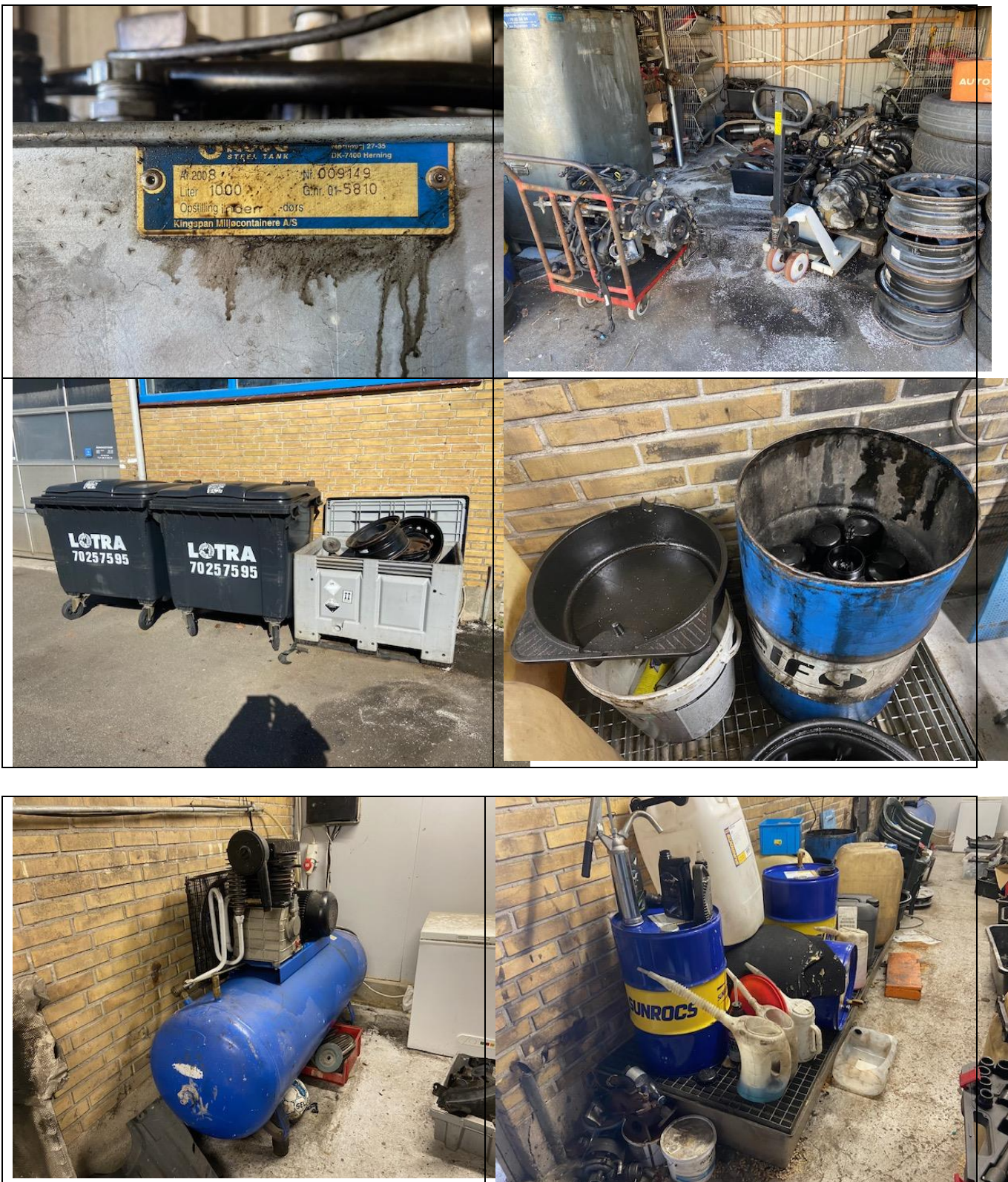
Billeder fra tilsynet, spildolietank og opbevaringsforholde for råvare og farligt affald samt placering af kompressor.