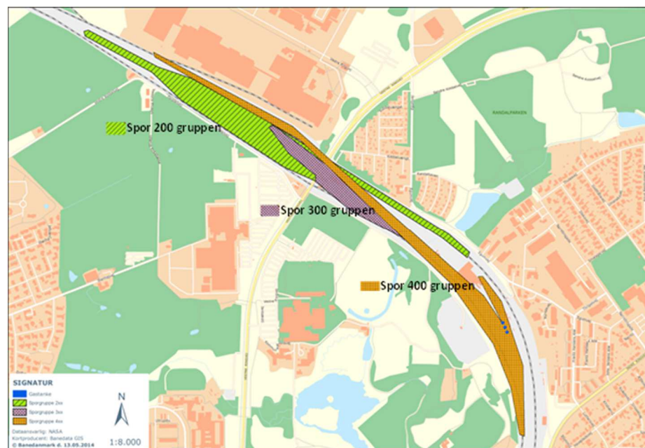
Figur VI-1 Fredericia Rangerbanegård med angivelse af sporgrupperne

I Figur VI-1 er vist et kort med angivelse af sporgruppe 200 (grøn og sort stribet farvemærkning), sporgruppe 300 (lilla farvemærkning) samt sporgruppe 400 (orange farvemærkning).