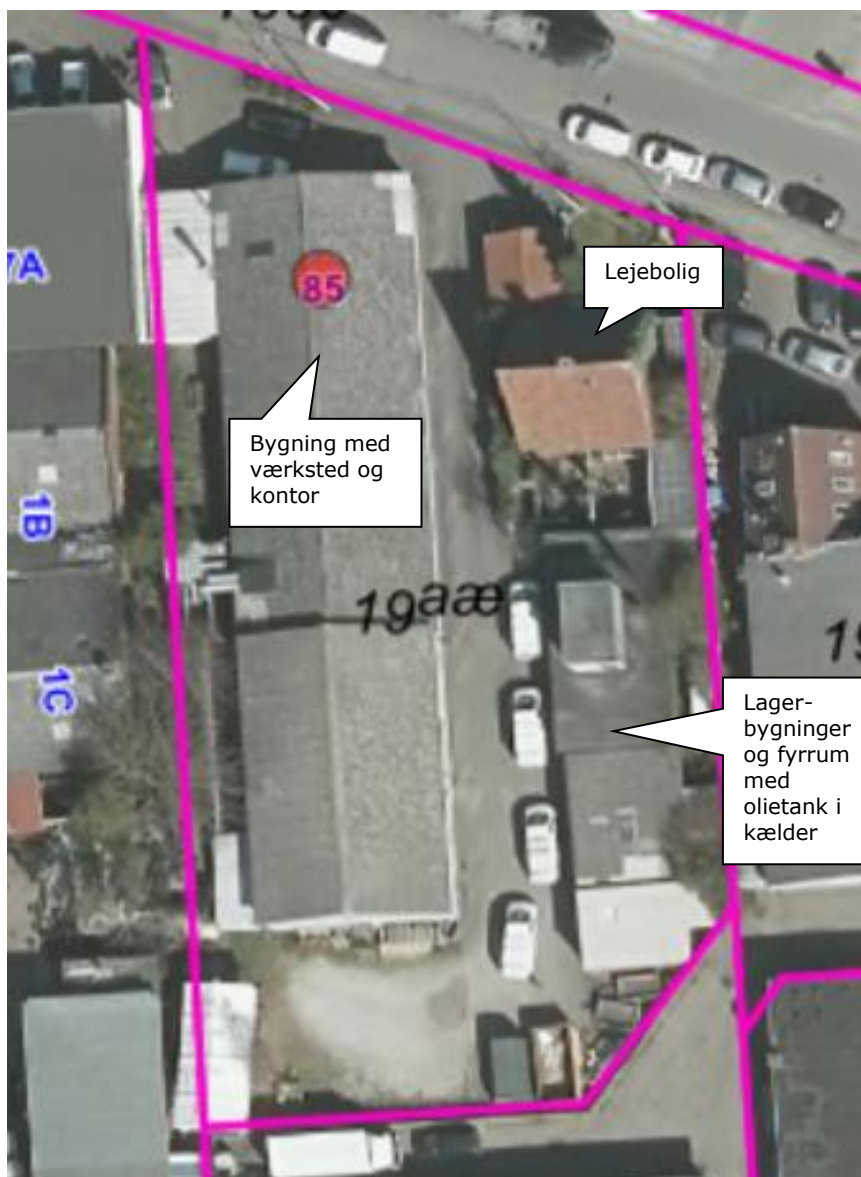
Luftfoto af virksomheden med matrikelskel

I forhold til kommuneplanen ligger virksomheden i erhvervsområde 150513ER, der er udlagt til erhverv, og som er omfattet af lokalplan 116. Der er enkelte boliger i området.