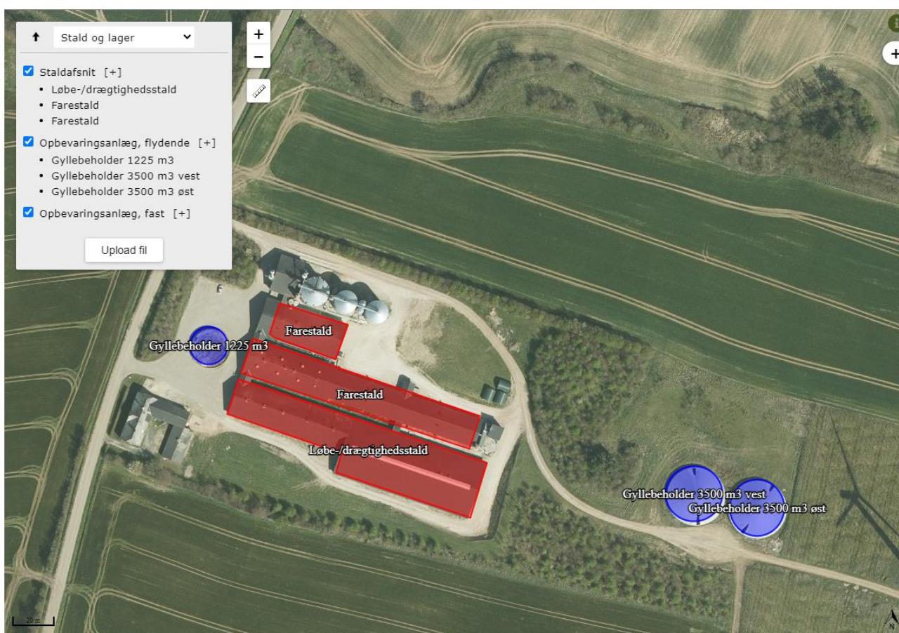
Figur 2. Oversigtskort over produktionsanlæg på Frørupvej 44.