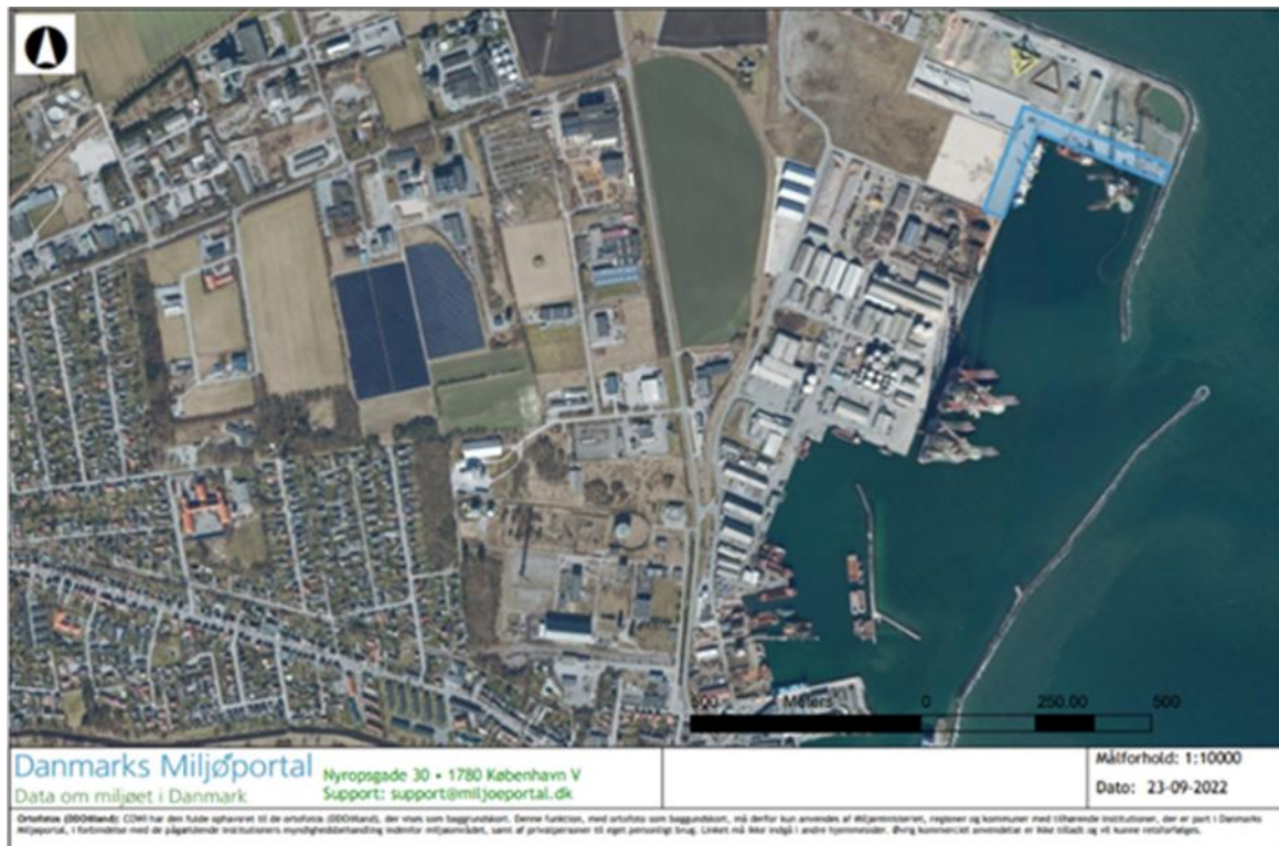
Billede 1. Luftfoto leveret af COWI A/S. Placeringen af aktiviteten er markeret med blå skravering.