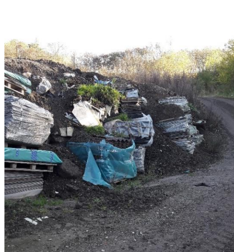
Figur 1. Deponering af affald på etape 6. 1) Tippen. 2) Indpakkede asbestplader. 3) Delvist afdækket asbest.