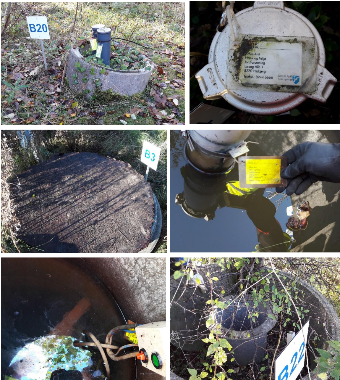
Figur 9. Overvågningsboringer. 1) Boring B20 – vandtæt lukning på forerør mangler og boringen er ikke aflåst. 2) Boring B4 – påsat skilt er ikke udfyldt. 3) Boring B3 - trælag på brøndring. 4) Boring B3 – vandfyldt brøndring. 5) Boring B8 – vandfyldt brøndring uden synligt forerør. 6) Boring B22, tjørn vokser indenfor brøndring.

Boring B8: Brøndringen var vandfyldt og forerøret var ikke synligt (figur 9, billede 5). Det var ikke muligt at nå bunden af den vandfyldte brønd med "målepind". Boringen er af ældre dato, men ukendt alder, og der findes ikke en borejournal for boringen i boringsdatabasen, hvormed indretningen af boringen ikke er kendt. Renosyd skal redegøre for, hvordan vandprøver udtages fra boringen.