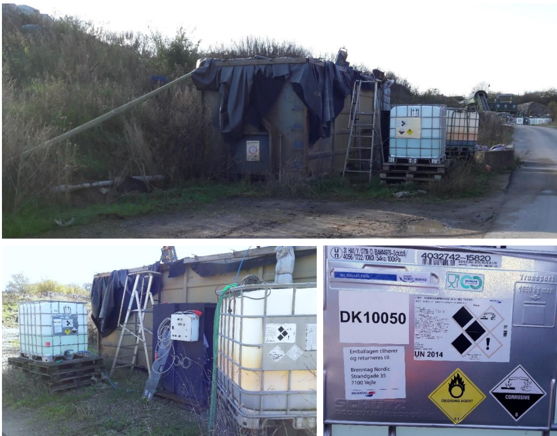
Figur 4. Perkolatbehandlingsanlæg. 1) Anlægget set fra nordøst. 2) Hydrogenperoxidbeholdere samt doseringsskab. 3) Faremærkning af hydrogenperoxid (brintoverilte).

Det eksisterende perkolatbehandlingsanlæg er et midlertidigt anlæg, der er udført som en nødløsning for at få håndteret svovlbrinteproblemerne. Renosyd har ad to omgange søgt om og fået miljøgodkendelse til et permanent perkolatbehandlingsanlæg. Renosyd har ikke taget nogen af miljøgodkendelserne til et permanent perkolatbehandlingsanlæg i brug, da Renosyd har erfaret, at en mere simpel behandling af perkolatet er tilstrækkelig. Perkolatbehandlingen, som pt finder sted, er således ikke miljøgodkendt og foregår uden vilkår. Miljøstyrelsen indskærper derfor godkendelsesbekendtgørelsens § 33, og Renosyd skal sørge for at få anlægget miljøgodkendt snarest muligt.