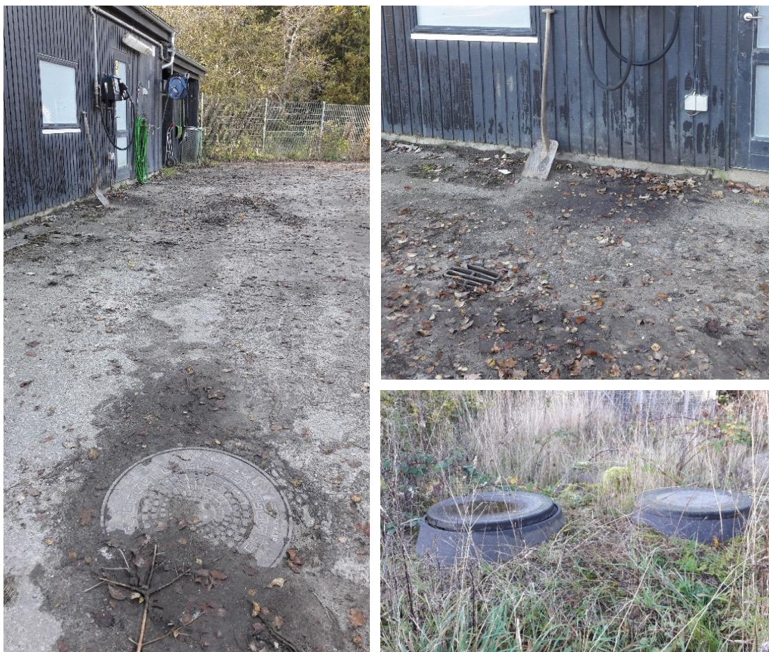
Figur 6. Olieudskillere. 1) Vaskeplads med dæksel til olieudskiller forrest. 2) Aftapningshane med sandfang forrest. 3) Olieudskiller og sandfang ved garage.

B10 - Stemmeværk: Prøvetagningsstedet er placeret vest-sydvest for det godkendte deponi, og ligeledes nedstrøms den gamle etape 0. Renosyd fortalte, at stemmeværket er en gammel konstruktion til opstemning af vandløbet, som ikke længere benyttes (figur 7, billede 1). På tilsynet blev der observeret en rimelig vandføring i vandløbet, som formodes nedstrøms at løbe sammen med Sønderbæk. Stemmeværket formodes ligeledes at ligge nedstrøms det kildevæld, som ligger nær B13 jf. oversigtskort.