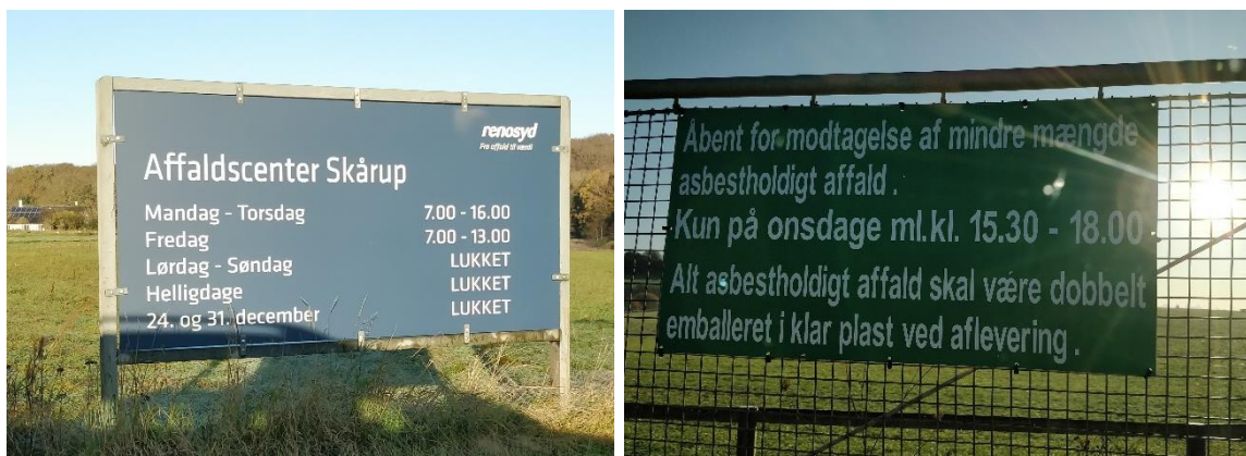
Figur 10. Skilte. 1) Åbningstider for Affaldscenter Skårup. 2) Åbningstid for modtagelse af mindre mængder asbest.

Ved indkørsel til anlægget er der placeret to skilte, som oplyser om anlæggets åbningstid og åbningstid for indlevering af mindre mængder asbest (figur 10). Driftstiden for indlevering af asbest stemmer ikke overens med anlæggets vilkår for driftstid, vilkår C1. Miljøstyrelsen indskærper derfor, at indlevering af asbest skal ske indenfor anlæggets åbningstider. Hvis Renosyd ønsker udvidede driftstider, skal de søge om miljøgodkendelse hertil.