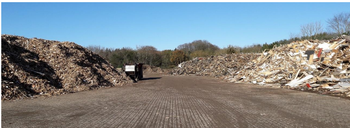
Figur 2. Oplag. 1) Elektronik og kemikalier, mellem etape 4A og etape 6. 2) Kompost og jernoplæg, etape 2.1. 3) Jernoplæg, etape 2.1. 4) Træflis t.v. og stort brændbart t.h., trykimprægneret træ bagerst, etape 3A.