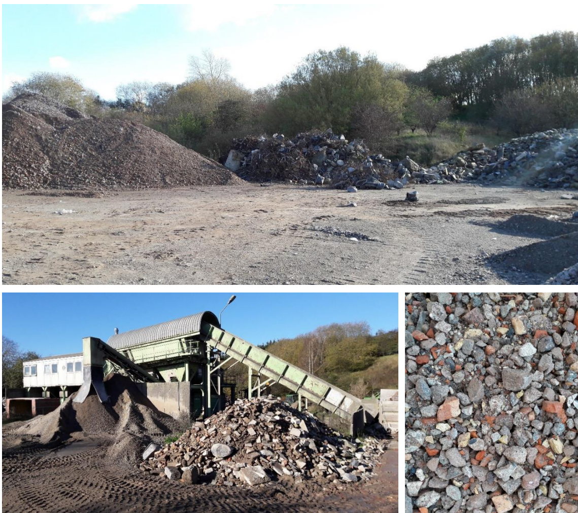
Figur 3. Sorteringsplads og –anlæg. 1) Plads med oplag af forskellige sorteringsfraktioner efter nedknusning af byggeaffald – bagerst ses frasorteret metal, primært armeringsjern, som først kan frigøres efter nedknusning. 2) Forsorteringsanlæg til bygge- og anlægsaffald. Anlægget sorterer fraktionerne på baggrund af størrelse. Herudover frasorteres løse plast og metalfraktioner. 3) Sammensætning af sorteringsfraktion, som afsættes til diverse byggeprojekter.