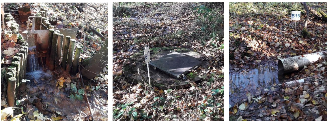
Figur 7. Prøvetagningssteder for overfladevand. 1) B10, stemmeværk. 2) B13, kilden ved siden af boring B18. 3) B15, omfangsdræn.