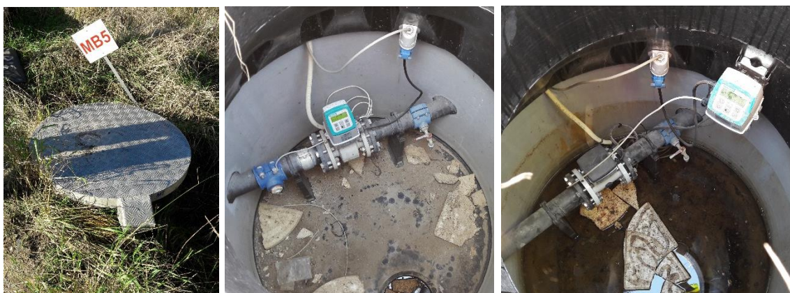
Figur 5. Perkolatbrønde. 1) MB5 - brønd til monitoring af perkolat fra etape 5. 2) Indretning af MB5. 3) Indretning af MB6.