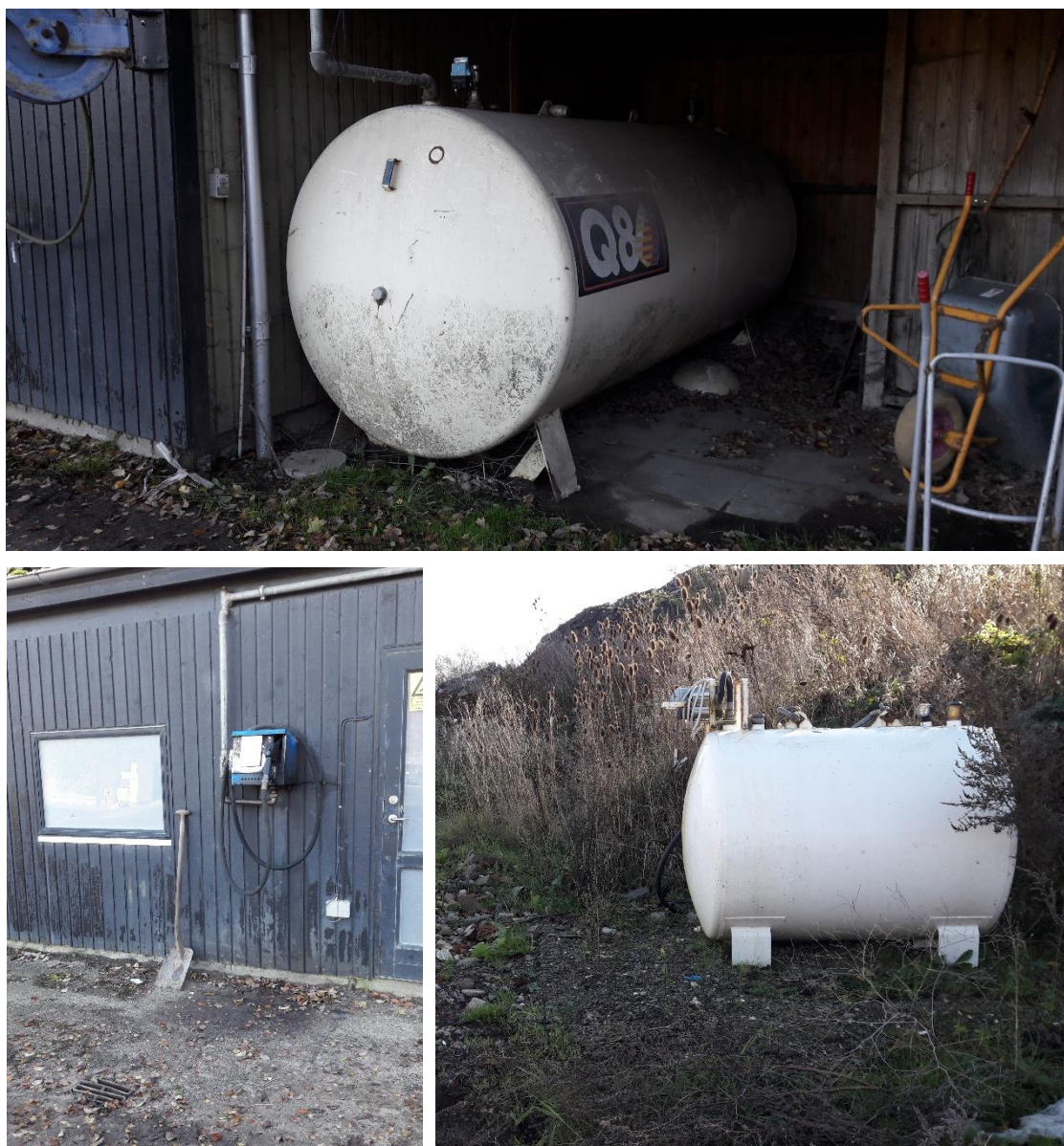
Figur 8. Olietanke. 1) Dieseltank til påfyldning af diverse maskiner. 2) Aftapningshane. 3) Mobil tank på etape 6 til brug for kompaktorer.

Anlæggets to olietanke lever ikke op til vilkår C12 i revurderingsafgørelsen af 23. december 2009. Ved den stationære olietank er der ikke etableret tæt belægning hverken under aftapningshanen eller påfyldningsstudsens. Den mobile tank på etape 6 er placeret på ubefæstet areal, hvormed spild uhindret kan ledes til deponiet, samt forurene jorden under tanken. Miljøstyrelsen indskærper derfor vilkår C12. Indtil de to tanke kan leve op til gældende vilkår, skal der anvendes spildbakker i forbindelse med påfyldning og aftapning.