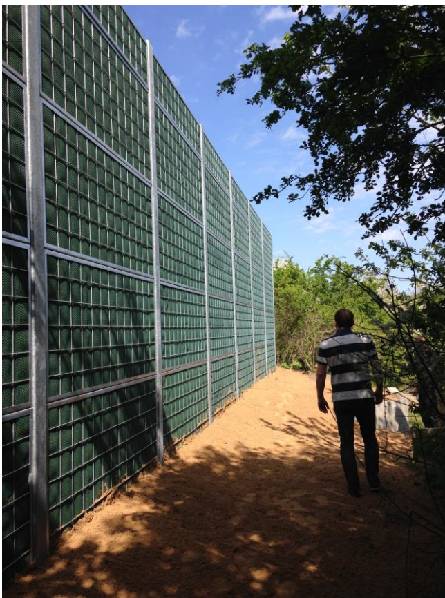
Højeste del af skærmen er godt 4 meter høj