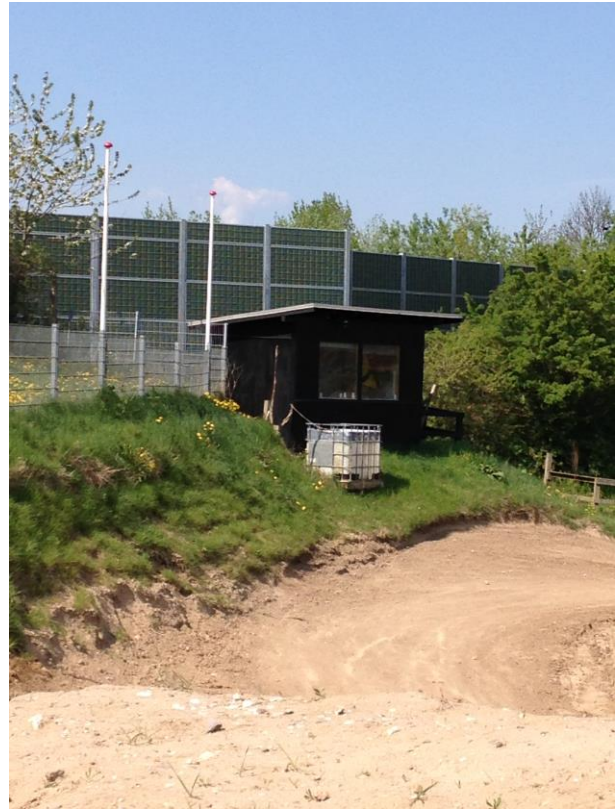
Skærmen set inde fra banen

De støjdæmpende foranstaltninger er udført i starten af 2016 og vurderes, at være etableret i overensstemmelse med ansøgningen/afgørelsen om etablering af støjdæmpende foranstaltninger. Den ydre skærm mod nord er på størstedelen af strækningen etableret med en højde ca. 25 cm over det forudsatte. Sænkning af banelegeme er ligeledes udført med minimum 0,5 meter. Generelt er interne volde også etableret med minimum 2 meters højde. Ved tilsynet blev der dog udpeget 2 delstrækninger, hvor det blev aftalt at der skulle ske forhøjelse af voldene. Når denne forhøjelse er udført anses de støjdæmpende tiltag for gennemført og banens støjvilkår for overholdt.