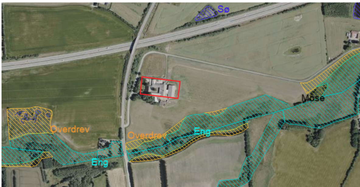
Figur 3 -Overblik over de naturpunkter omfattet af §3 eller kategori 3, som er beliggende tættest på Storskovvej 80, hvori merdepositionen af ammoniak-kvælstof fra Storskovvej 80 er beregnet. Viser kun områder hvor total depositionen er over 0,0.

Med baggrund i det ovennævnte notat er det Brønderslev Kommunes vurdering, at det normalt ikke vil kunne føre til tilstandsændringer i kategori 3 natur og § 3 beskyttet natur, hvis merdepositionen på under 1 kg NH 3 -N/ha/år.