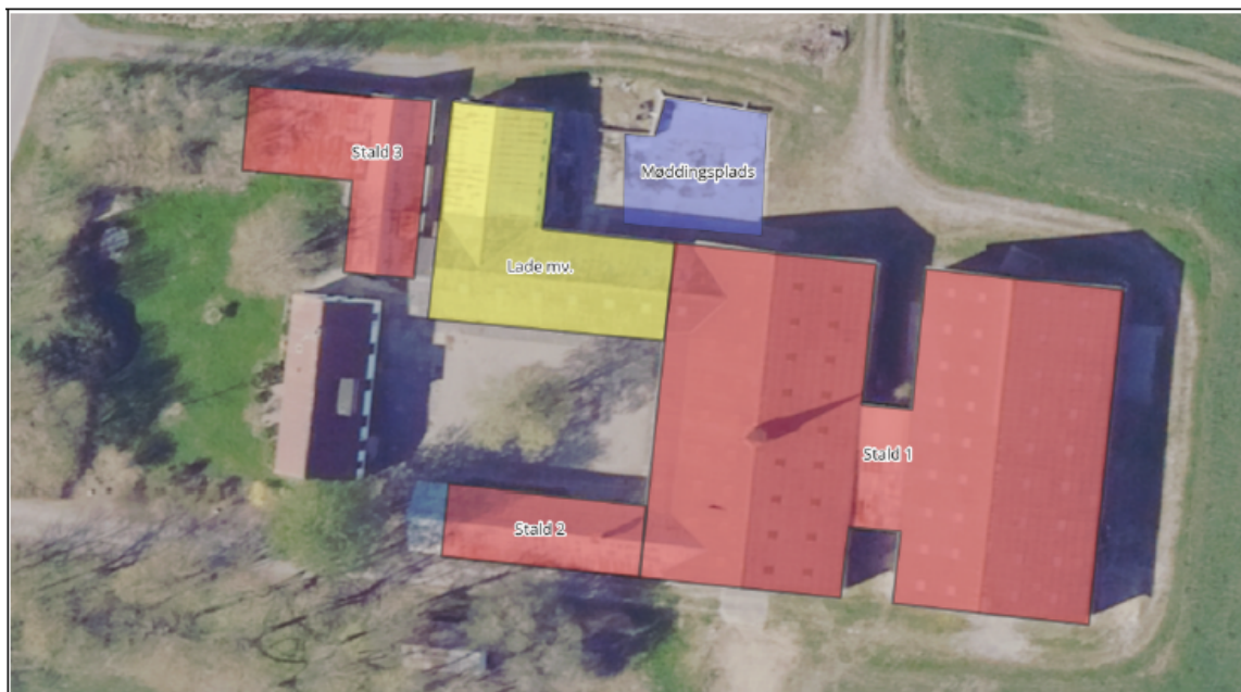
Figur 1 -Oversigt over husdyrbruget ved den ansøgte drift på Storskovvej 80.

Miljøgodkendelsen er givet på en række vilkår, som fremgår af kapitel 4. I kapitel 5 er der nærmere beskrivelse af, hvordan kravene er overholdt og begrundelse for de stillede vilkår.