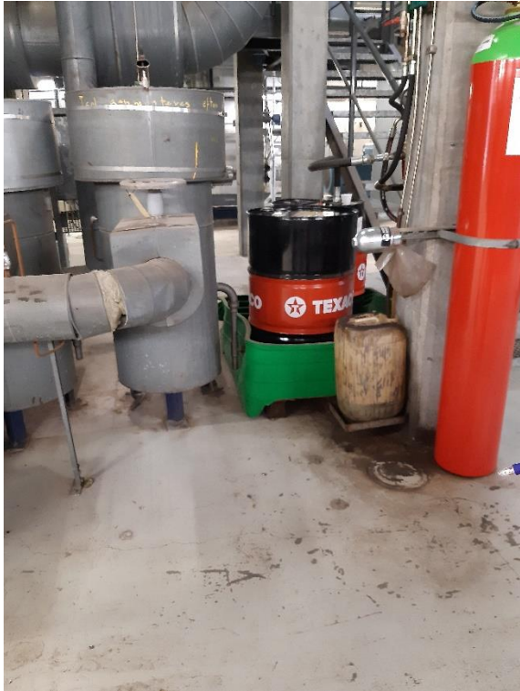
Spildebakke under olietønder