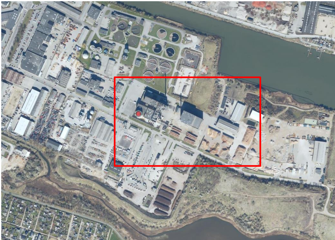
Luftfoto af Fjernvarme Horsens – affaldsforbrænding og gasturbine til venstre, biomassevarmeværk i midten, flislager til højre.

Senest basistilsyn er udført i 23. september 2021. Tilsynsrapporten er offentliggjort den 5. november 2021.