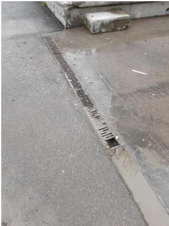
Afløb ved slaggegård

Miljøstyrelsen vil bemærke, at virksomheden skal sørge for, at risten skal være ren og uden slaggerester, så vandet kan afledes fra slaggegården og området omkring.