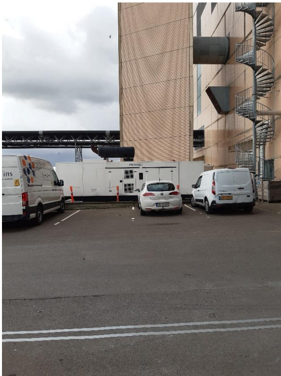
Nødstrømsanlægget ses bag bilerne.

Anlæg til nødstrøm blev besigtiget og virksomheden orienterede om, at nødstrømsanlægget kan under udfald eller black-out fortsat drifte begge affaldslinjer, condenser og gasturbine. Dokumentation for dette jf. vilkår C24 har virksomheden eftersendt.