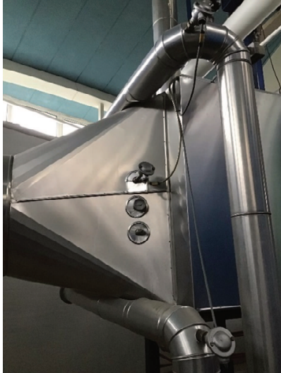
Målested, kedel 2 og 4 (olie og gas), der er ingen krav om støvmåling nu eller fremover. Kun NO x og CO.