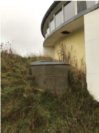
Jordvold bag cirkulær driftsbygning (gl. gaslager). Brønd kan være påfyldningssted til fyringsolietanken.