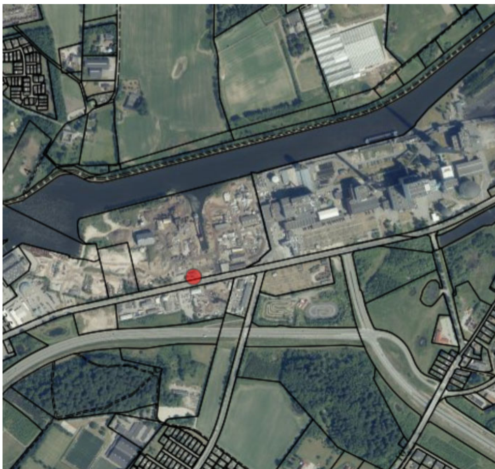
Matrikelkort, Ortofoto sommer 2018.