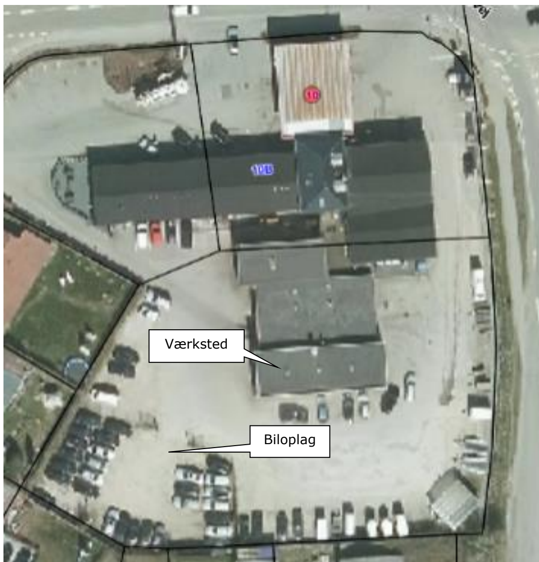
Luftfoto af virksomheden med matrikelskel anno 2019

I forhold til kommuneplanen ligger virksomheden i område 340111BL. Virksomheden er etableret i et værksted i den sydlige del af bygningen og har et udendørs oplag af biler på et indhegnet grusareal mod sydvest.