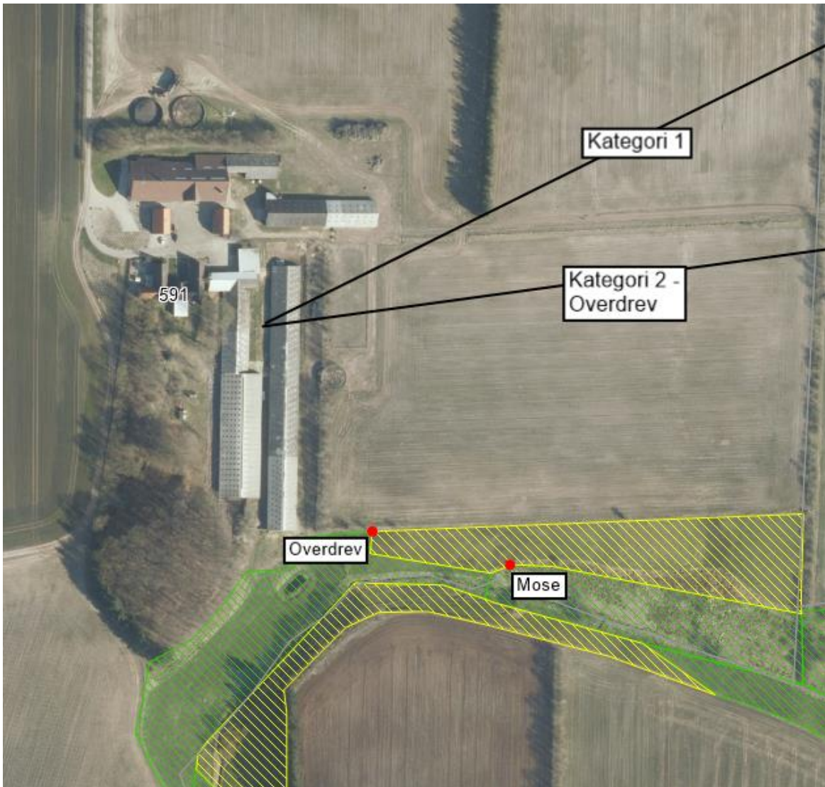
Figur 3: Naturpunkter i forhold til husdyrbruget