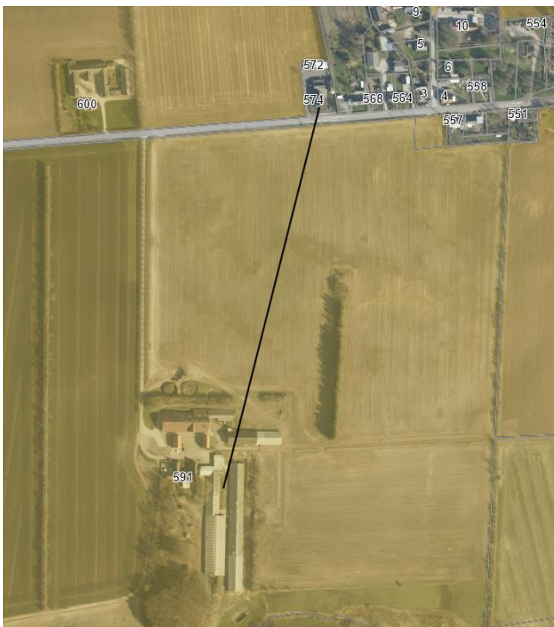
Figur 4: Nærmeste nabo uden landbrugspligt

Som det ses af Tabel 4 , overholder den ansøgte produktion lovens minimumskrav til lugtgeneafstande til de forskellige typer af beboelser i området.