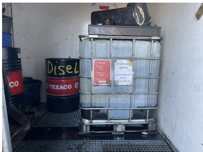
1 Opbevaring af farligt affald og andet flydende olie/kemikalie

Opbevaring af spildolie sker i en container indrettet med spildbakker (se billede 1).