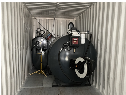
2. Dieseltanke i container

Den nuværende indretning med dieseltankene lever ikke op til ovennævnte krav og Norddjurs KOMMUNE skal således gøre opmærksom på at I bør indrette tankene således at de gør det, snarest muligt og senest ved anmeldelsestidspunktet.