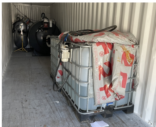
3 AdBlue i pallettanke i container

Ved tilsynet blev virksomhedens fyringsolietanke og dieselolietank til malerkabine ikke set og det blev derfor heller ikke noteret hvilke underlag de er opstillet. I bør sikre at de også lever op til § 32. Vær især også opmærksomme på at det også gælder påfyldningsstude, ikke kun aftapningsanordninger.