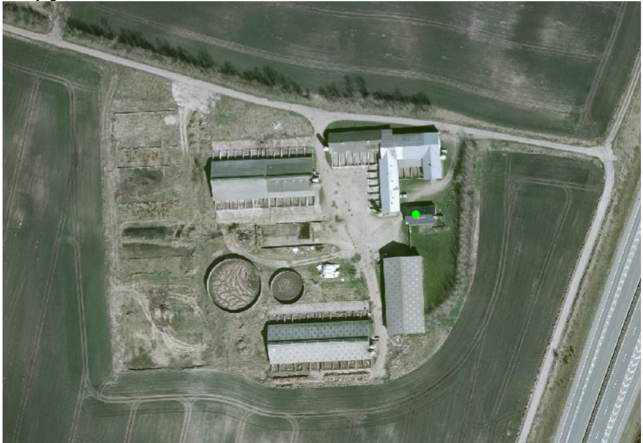
Figur 2. Stenisengevej 20.

2.4 Hensyn til landskab § 12 miljøgodkendelsen er ikke blevet udnyttet fuldt ud, da de godkendte stalde ikke er blevet bygget. Der er ikke ansøgt om etablering af disse stalde i tillægget til miljøgodkendelsen.