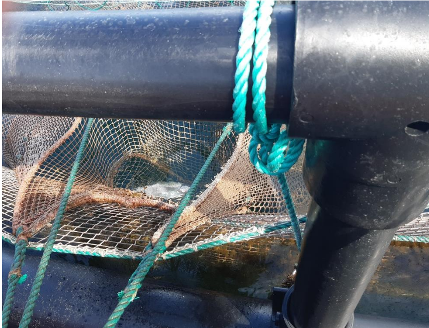
Figur 4: Tømning af dødeposen.

Døde fisk falder til bunds og ender i dødeposen. Posen kan tømmes fra foderskibet og kontrolleres dagligt. Døde fisk opbevares i en container på foderskibet, som tømmes en gang om ugen i Snaptun. Her sendes de døde fisk videre til Vicus Biogas.