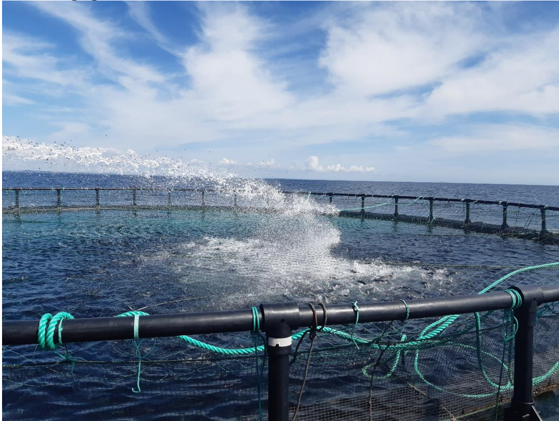
Figur 2: Fodring af fisk med foderkanon.

Nordby Bugt Havbrug har 4 netbure med regnbueørred ( O. mykiss ) på lokaliteten. Fiskene er udsat fra dambrugene Årup Mølle og Hoven Mølle. Virksomheden oplyste, at der er i alt er udsat 96.000 kg fisk. Hvert bur er tilført 4 læs fisk af ca. 6.000 kg, hvilket svarer til ca. 24.000 kg fisk per bur. Ved hvert læs er der udtaget en prøve på ca. 40-50 kg fisk, hvor antallet af fisk optælles. Ud fra denne optælling kan der findes et estimat af antallet af fisk i det pågældende læs. Ud fra disse optællinger har virksomheden estimeret et samlet antal udsatte fisk på 99.208 stk.