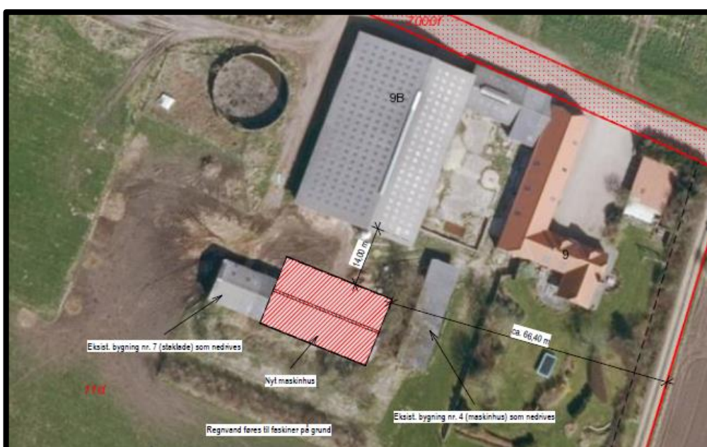
Figur 1: Situationsplan med placering af nyt maskinhus