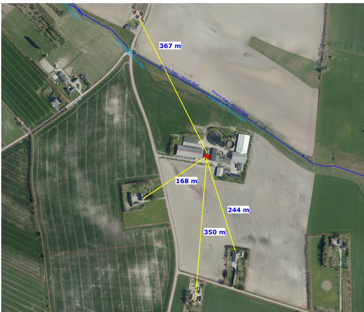
Afstande til naboer