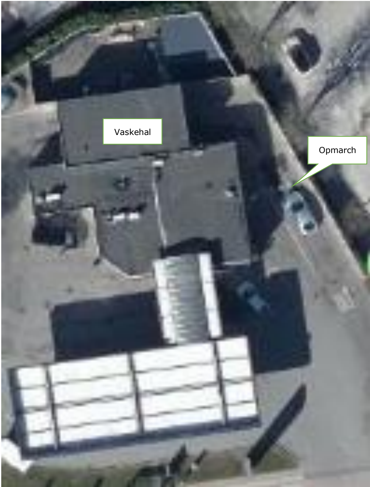
Opmarch til vaskehal langs skel til Allegårdsvej med mulighed for forvask