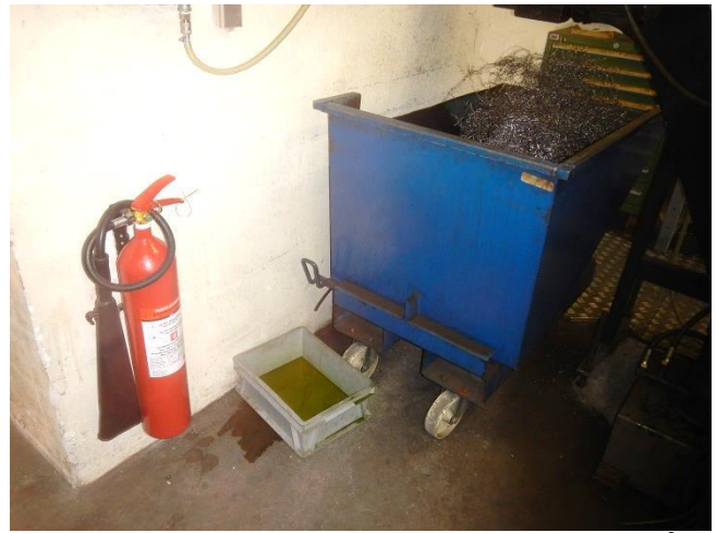
8. Produktionshal. Lille container til bore- drejespårner. Afdryp sker til opsamlingsbakke.