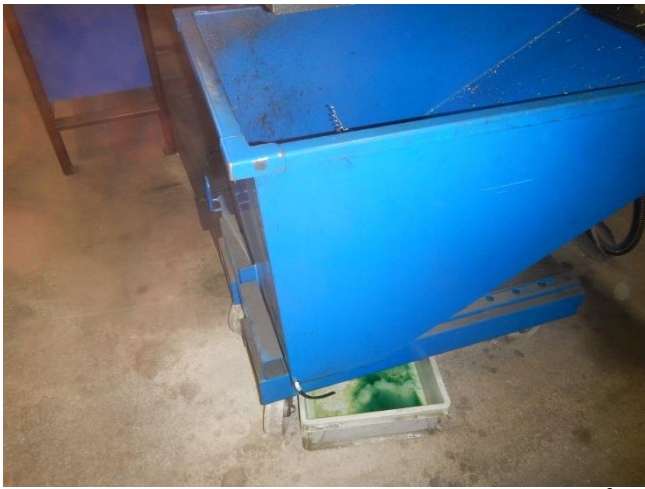
7. Produktionshal. Lille container til bore- drejespårner. Afdryp sker til opsamlingsbakke