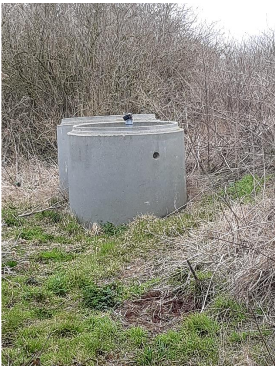
Foto 3. Perkolat- og pejleboring