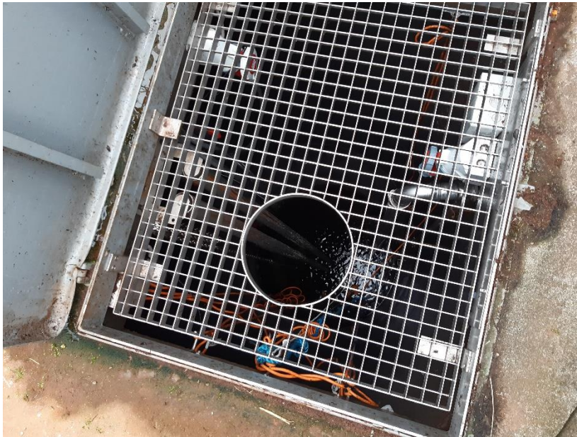
Foto 4. Perkolatpumpebrønd hvorfra perkolat pumpes op, og ledes til renseanlægget.

Ved gennemgang af gældende vilkår, blev der ikke fundet vilkår der er overtrådt. Der er ingen bemærkninger til gennemgang af vilkår.