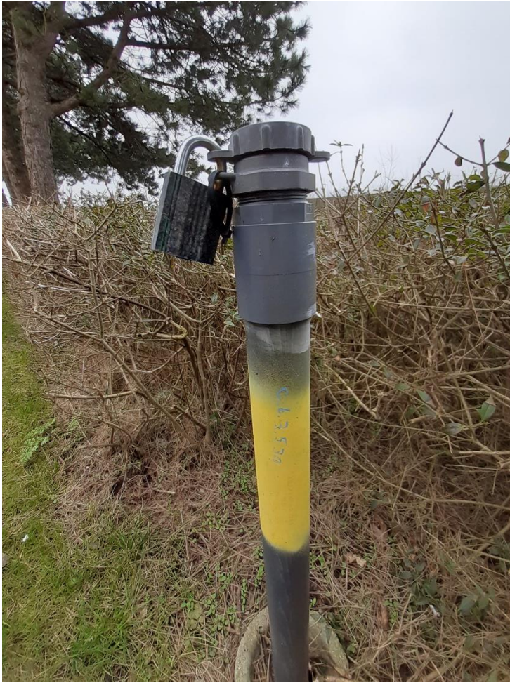
Foto 2: Prøvested for grundvandsmonitoring, lige udenfor deponiets østlige afgrænsning.