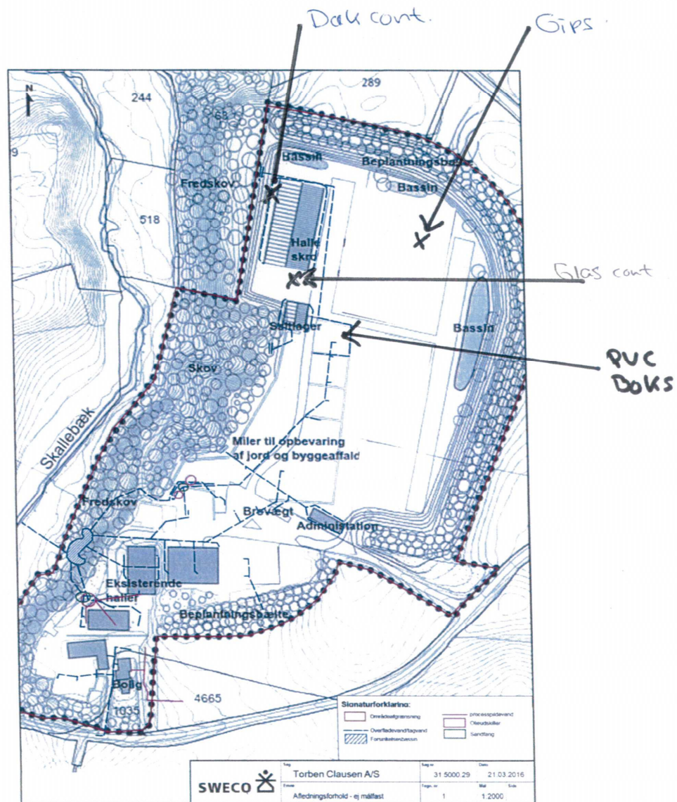
Bilag 4. Afledningsforhold.