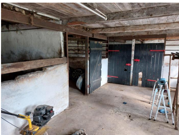
Nogle af de 7 bokse