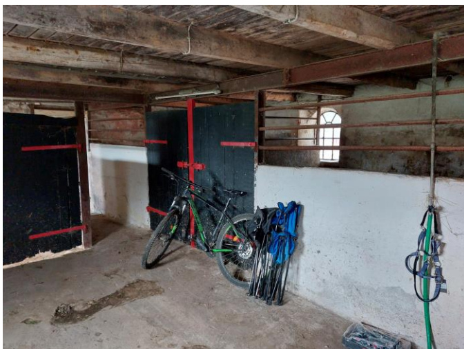
Nogle af de 7 bokse