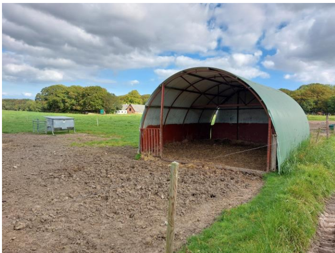
Et flytbart læskur. Flyttes mindst 1 gang årligt til ny placering jf. gældende regler.