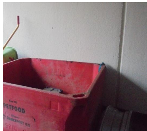
Opbevaring af bil-batterier