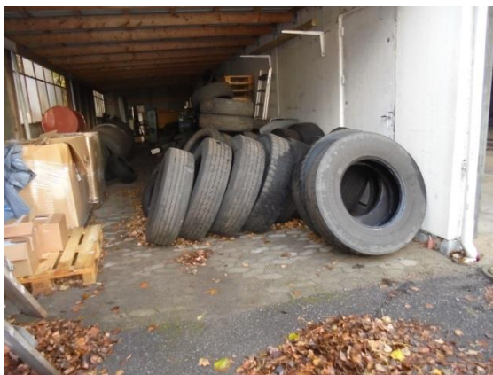
Opbevaring af dæk