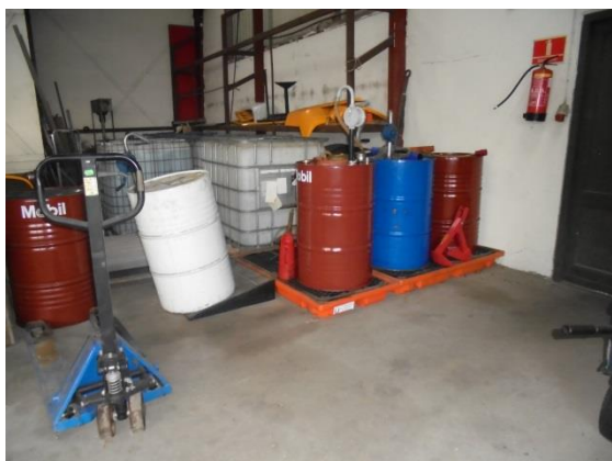
Flydende råvarer på spildbakke

Flydende råvarer, opbevares på spildbakker i garagebygningen. Spildolie opbevares i en dobbeltvægget spildolietank på 1.000 liter. Tanken er placeret under et halvtag vest for værkstedsbygningen. Spildolietanken er senest tømt af Avista Oil 28-09-2016. Kvittering for tømning blev fremvist under tilsynet.