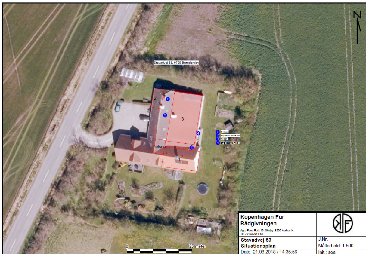
Figur nr. 1. Anlægstegning.

Afstandskrav og faktiske afstande jf. husdyrbruglovens § 6 og § 8: