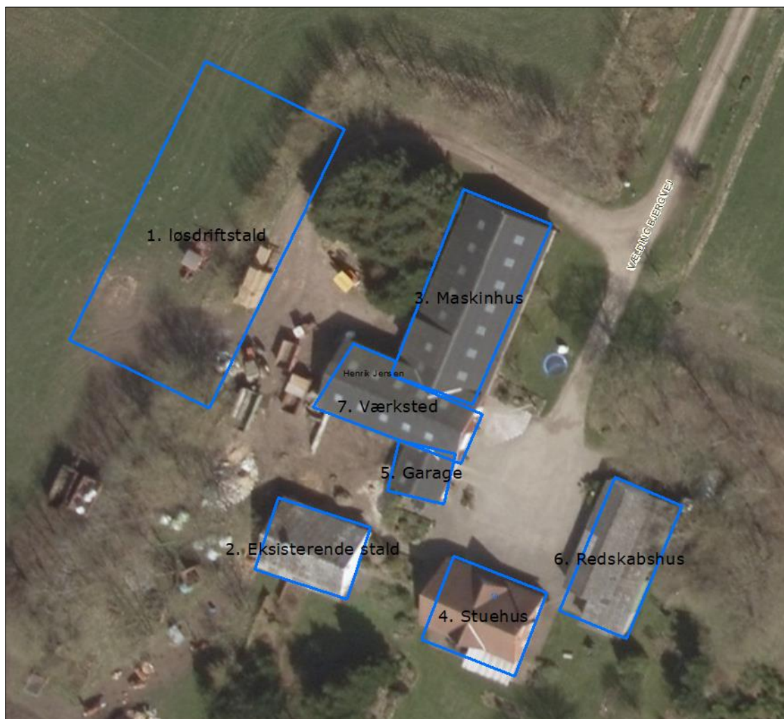
Figur 1. Husdyrbrugets driftsbygninger.

Der vil fremover være følgende bygninger på ejendommen: