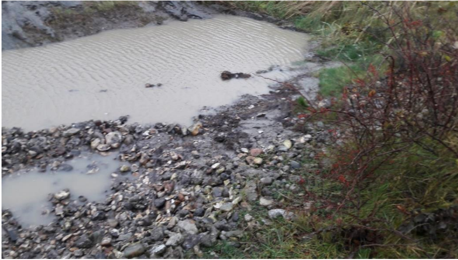
Foto 4: Renden set fra den gamle fabriksgrund. Der er kun efterladt lidt sediment på stensætningen.