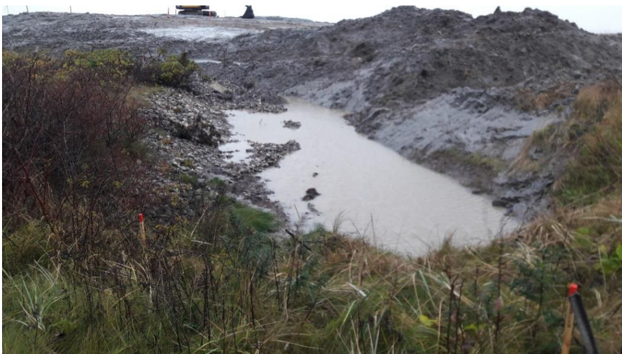
Foto 3 set mod øst. Til venstre ses skrænten op mod den gamle fabriksgrund. Den vandfyldte rende er fritgravet for sediment, som er placeret i bunken til højre for renden dvs. inde på depotet.

På tilsynet kunne det også konstateres, at der allerede var gravet sediment væk fra skrænten op mod den gamle fabriksgrund i den sydlige ende af depotet. Det bortgravede sediment var lagt i en bunke på sedimentdepotet med henblik på at tage analyser af jorden, se foto 3. Der var kun efterladt ganske lidt sediment på skrænten op til den gamle fabriksgrund, der hvor oprensning havde fundet sted, se foto 4. Hegnet var ikke fritgravet endnu, men det kunne ses, at det var bøjet skævt som følge af trykket fra sedimentet, se foto 5. Det kunne konstateres, at der var kommet spredte sten fra skrænten på den gamle fabriksgrund med tilbage i sedimentet, der støder op mod deponiet, se foto 6.