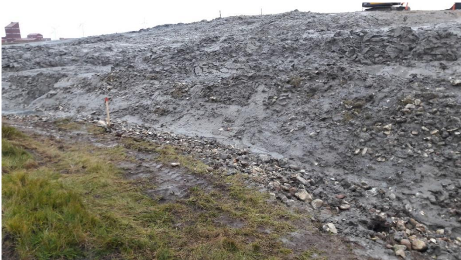
Foto 6 set mod nordøst fra den gamle fabriksgrund. Det ses, at der ved afgravningen er kommet spredte sten med fra skråningen af den gamle fabriksgrund over mod deponiet. Hegnet er helt dækket med sediment.