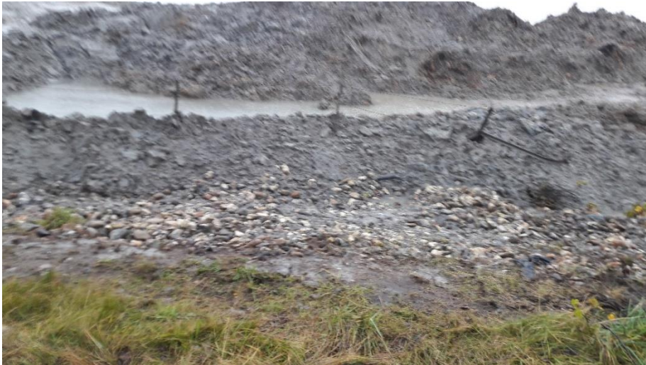
Foto 5 set mod øst fra den gamle fabriksgrund med fritgravet stensætning. Det skævvridte hegn ses i sedimentkanten efter afgravning. Bortgravet sediment ses i baggrunden på deponigrunden.