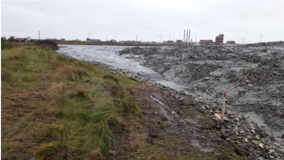
Foto 2 taget i nordlig retning fra den gamle fabriksgrund. Sediment flydt op ad skrænten med stensætning og ca. 1 meter ind på den gamle fabriksgrund (i venstre øverste del af billedet). Hegnet er dækket til af sedimentet på nær nogle få hegnspæle, der stikker op ud for "sedimenttungen". I højre del af billedet ses det område, der er renset op efter de første udflydinger.

Det blev aftalt med Thyborøn Havn, at aflæsning af sediment med øjeblikkelige virkning (fra 4. nov. 2019) blev flyttet til den nordlige rampe.