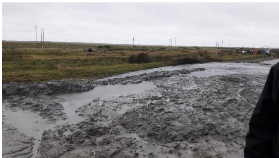
Foto 1 set fra sydlig rampe mod nordvest. Sediment flydt op ad skrænten til den gamle fabriksgrund i weekenden den 2.-3. november 2019.

På tilsynet kunne det konstateres, at sediment igen var flydt igennem og over hegnet, der adskiller deponi og den gamle fabriksgrund, se foto 1 og 2. Det blev oplyst af Thyborøn Havn, at det var sket umiddelbart før tilsynet i weekenden den 2.-3. nov. 2019, og at de først så det på tilsynet. Thyborøn Havn oplyser, at sedimentet var mere flydende end forventet. Thyborøn Havn var indstillet på at fjerne sedimentet, men oplyste på tilsynet, at der kunne gå op til 4 måneder, før sedimentet var tørt nok til at blive fjernet.