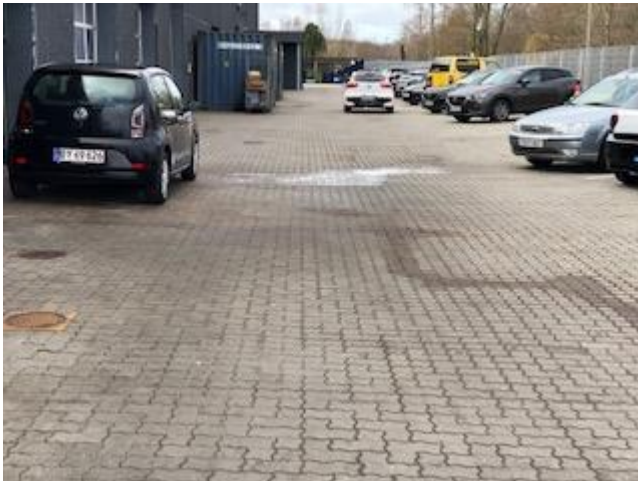
Figur 2 Nyvasket bil, som også havde fået højtryksspulet motorrummet. Vandet går via olieudskiller til regnvandssystemet

I bedes anmelde jeres aktiviteter, herunder udendørs bilvask med højtryksspuling, og vi vil herefter tage stilling til, om det kan tillades på det aktuelle sted.