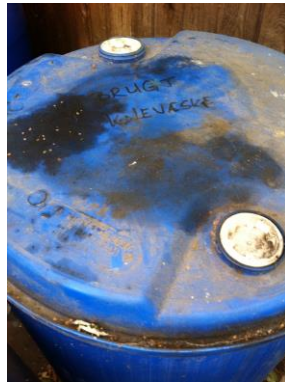
Tønde til brugt kølevæske