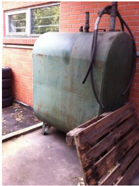
Tank til spildolie