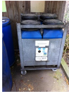
Tønder til oliefiltre

Der er siden tilsynet den 27. august 2015 indkøbt skab til opbevaring af spraydåser, påført pumpe på dunke med væsker samt installeret spildbakke. Se nedenstående billeder.