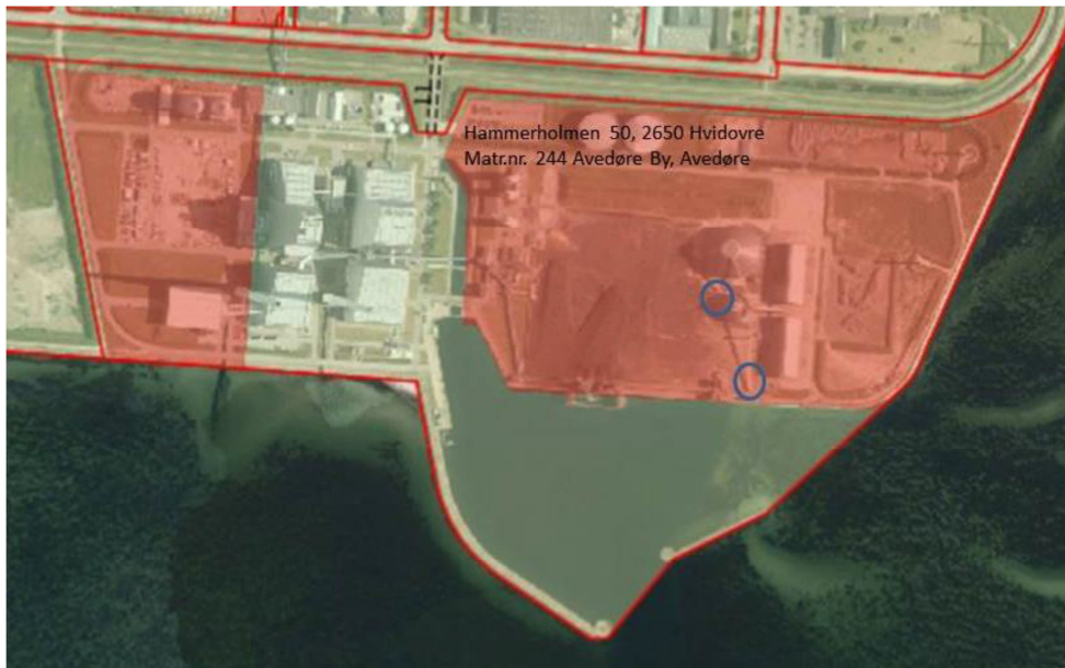
Figur 1. Oversigtskort. Det røde område er depot for flyveaske/slagge der er V2-kortlagt. De to blå cirkler viser dels udvidelsen af det eksisterende tankanlæg (nord) samt placering af brandvandspumpehuset (syd).

Samlet opgravning fra området forventes at være ca. 50 m 3 .