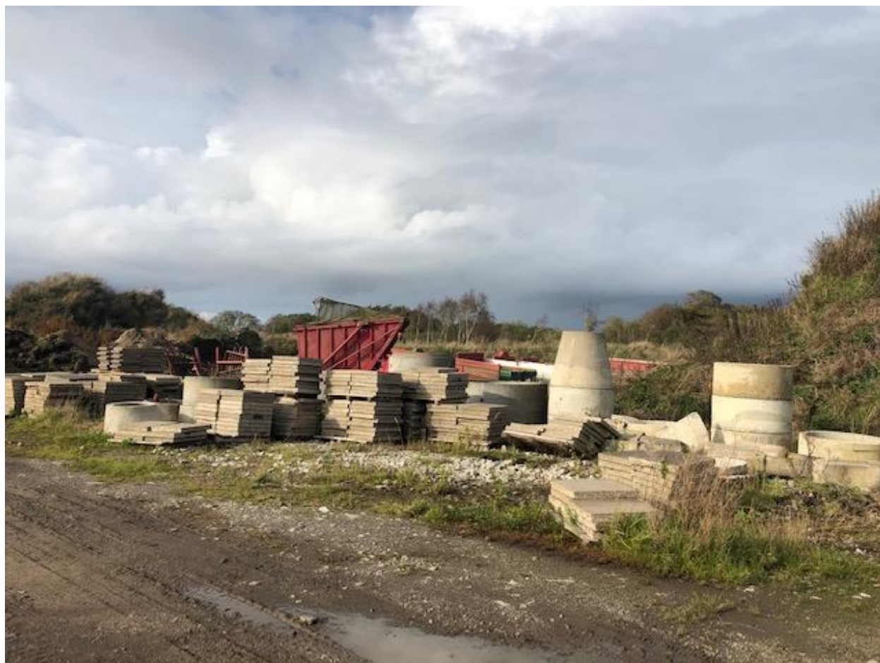
Bilag 3. Fotos af oplag på Øster Kærvej 50 den 9. oktober 2019