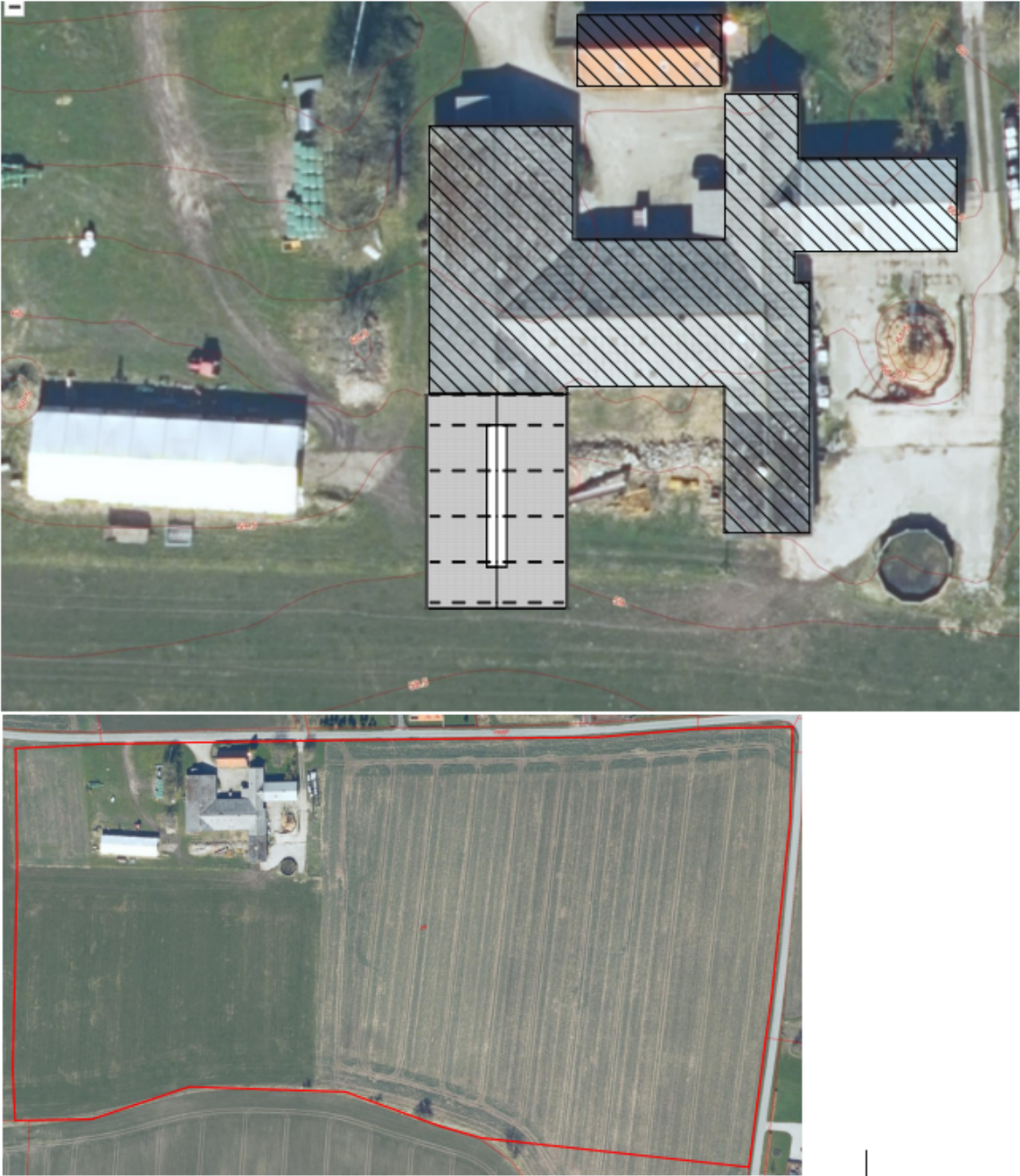
Figur 1. Situationsplan for byggeriet indsendt af HK TOTALBYG A/S.