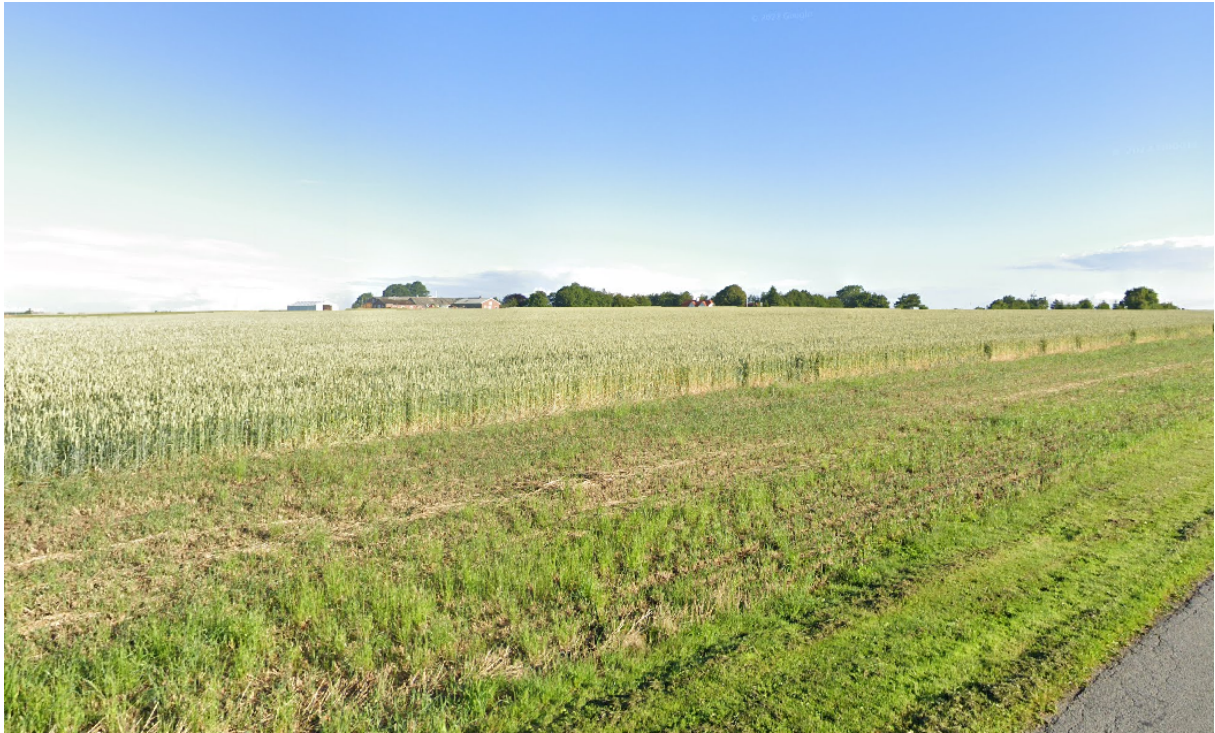
Figur 3. Udsigt fra Tingvadvej 16, 7130 Juelsminde.