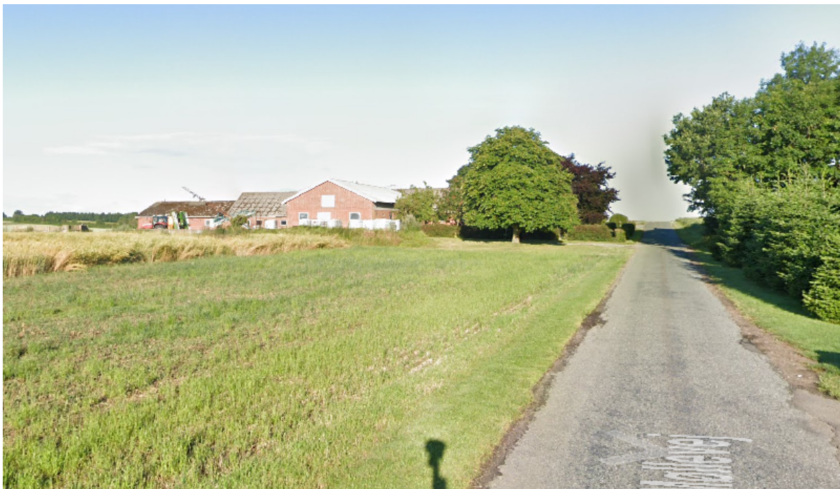
Figur 2. Udsyn fra Gram Møllevej 3, 7130 Juelsminde, hvor maskinhuset vil være skjult af eksisterende bygning.