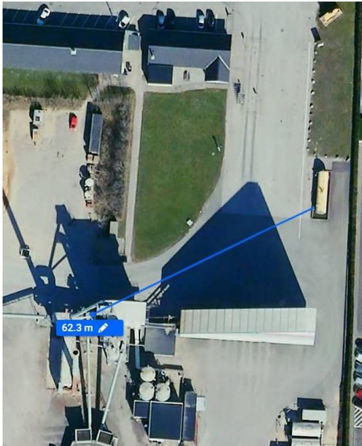
Figur 1: Billedet viser luftfoto af virksomheden med angivelse af afstand fra eksisterende brændstoftank til tørretromlen.

Det samlede oplag af brændstof på matriklen ændres ikke væsentligt.