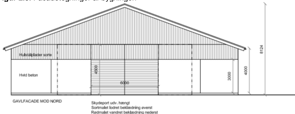
Figur 2.3. Facadetegninger af bygningen

Den ansøgte bygning måler ca. 20 x 37 meter i grundplan og er 8,2 meter høj til tagryggen – se figur 2.3 nedenfor. Bygningen vil blive etableret i lignende elementer som eksisterende bygninger.