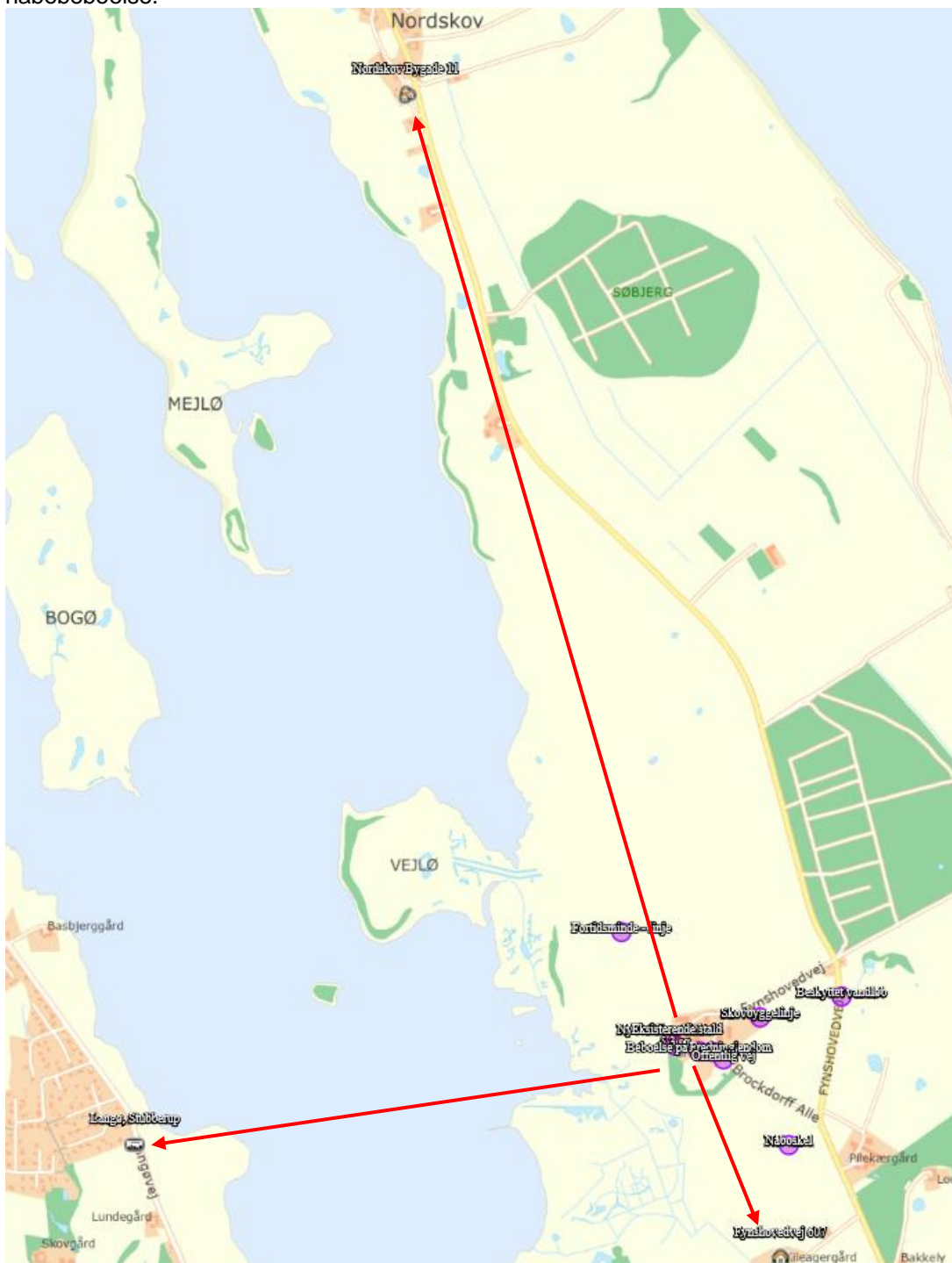
Tabel 2.1. Korteste afstand fra den nye stald til nabobeboelse, samlet bebyggelse og byzone/sommerhusområde.