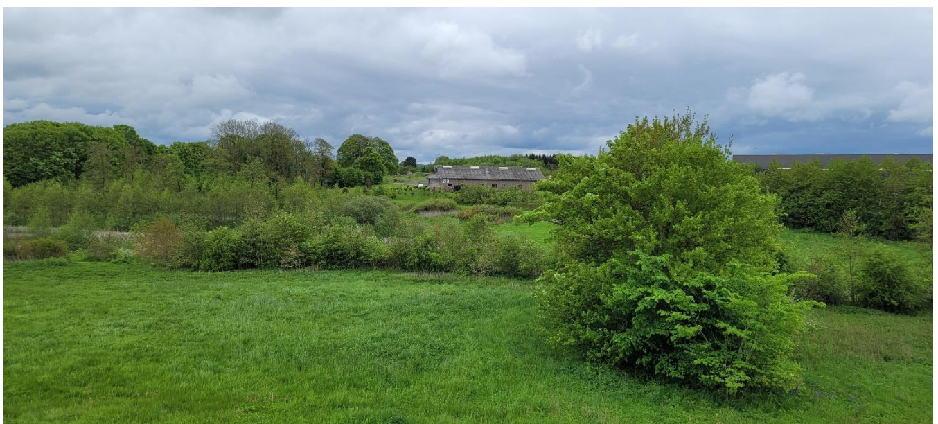
Mod syd i retning af klagers bolig. Set fra støjvolden ved teknikrummet.