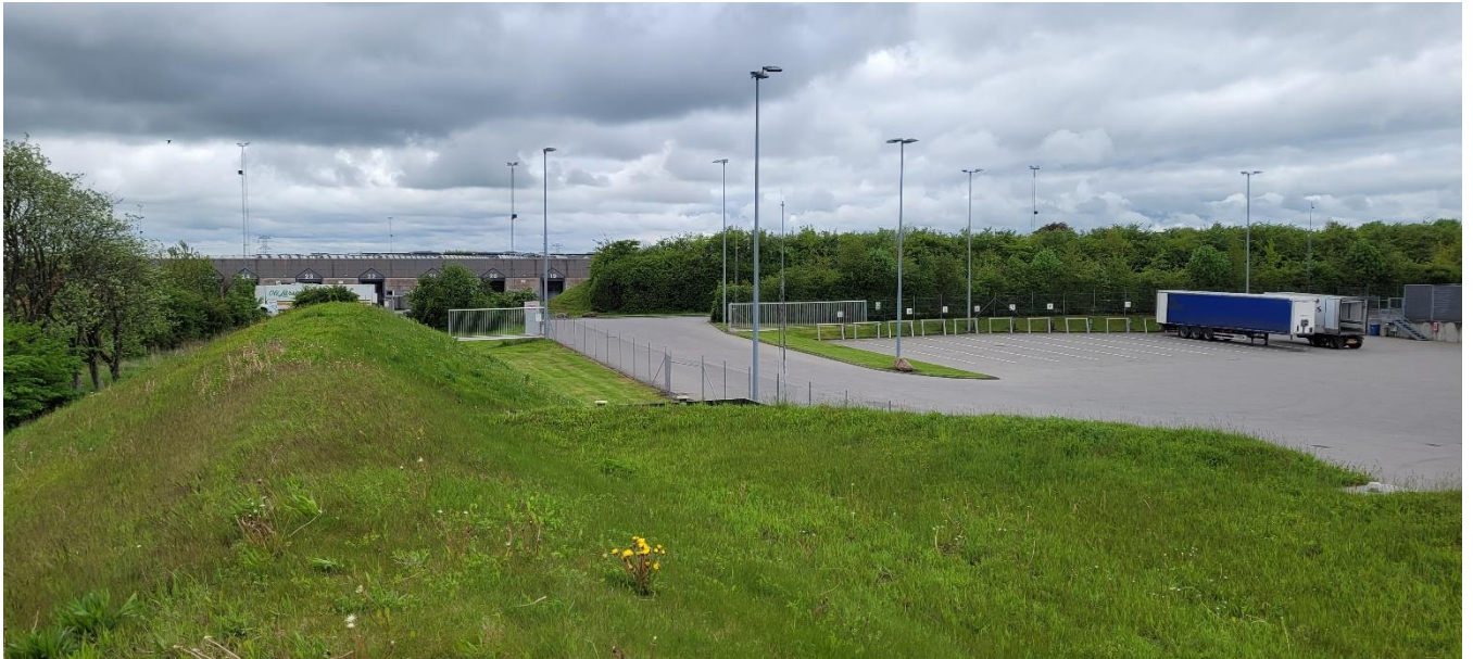
Set fra støjvolden mod vest (del af gården ved dispatch ses til højre).