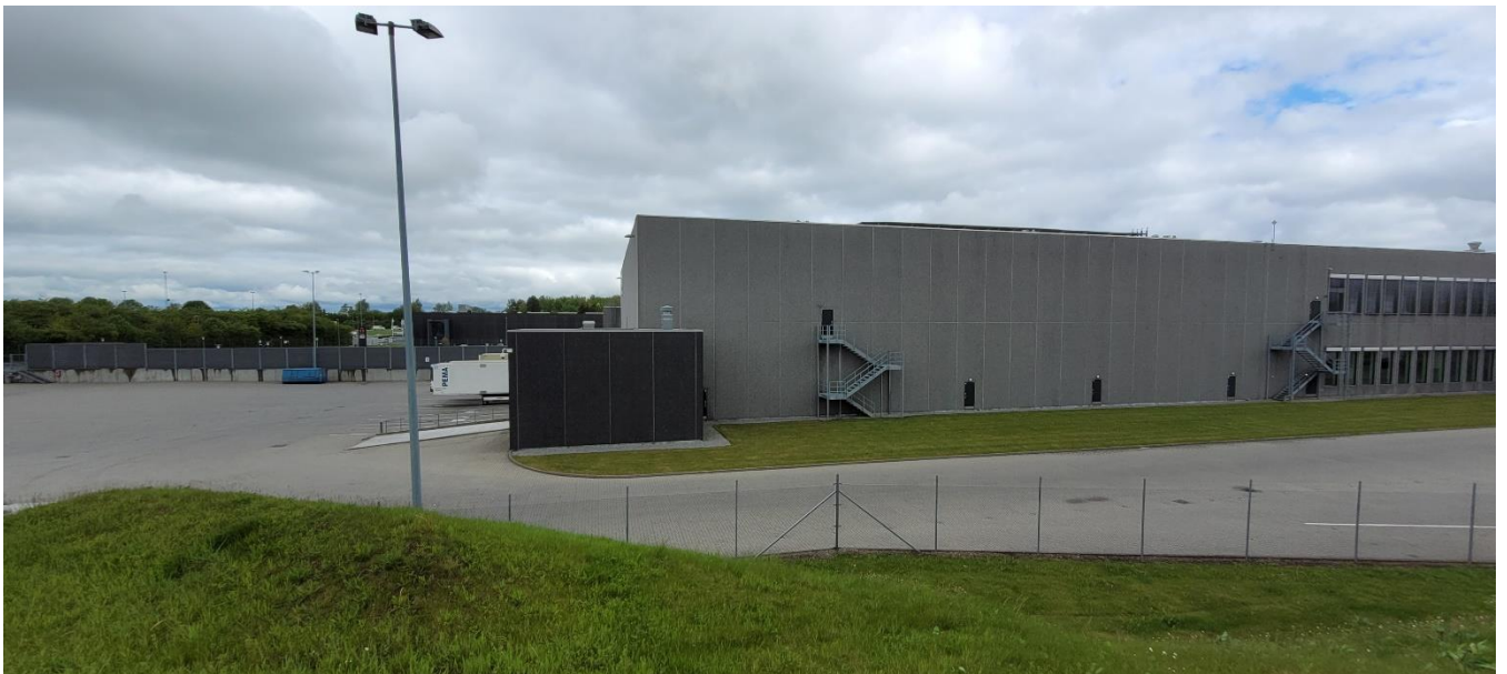
Set fra støjvolden ved teknikrummet med støj-reflekerende fabriksfacade.