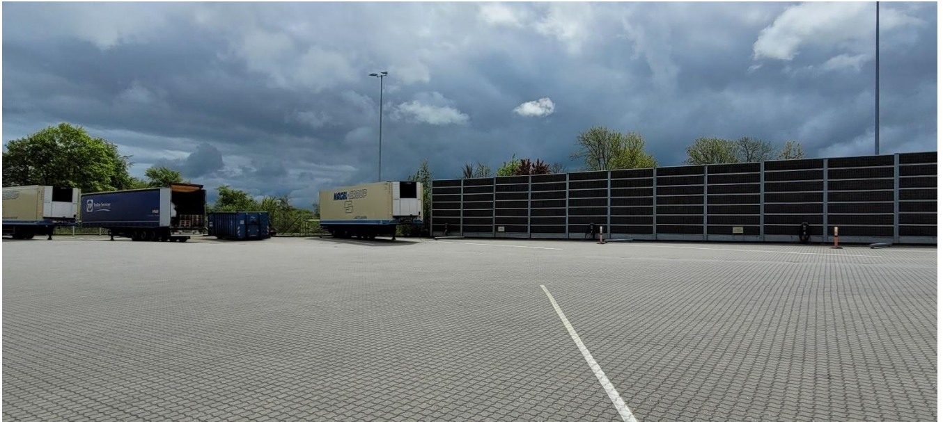
Køletrailere i gården ved dispatch, som ikke var i drift.