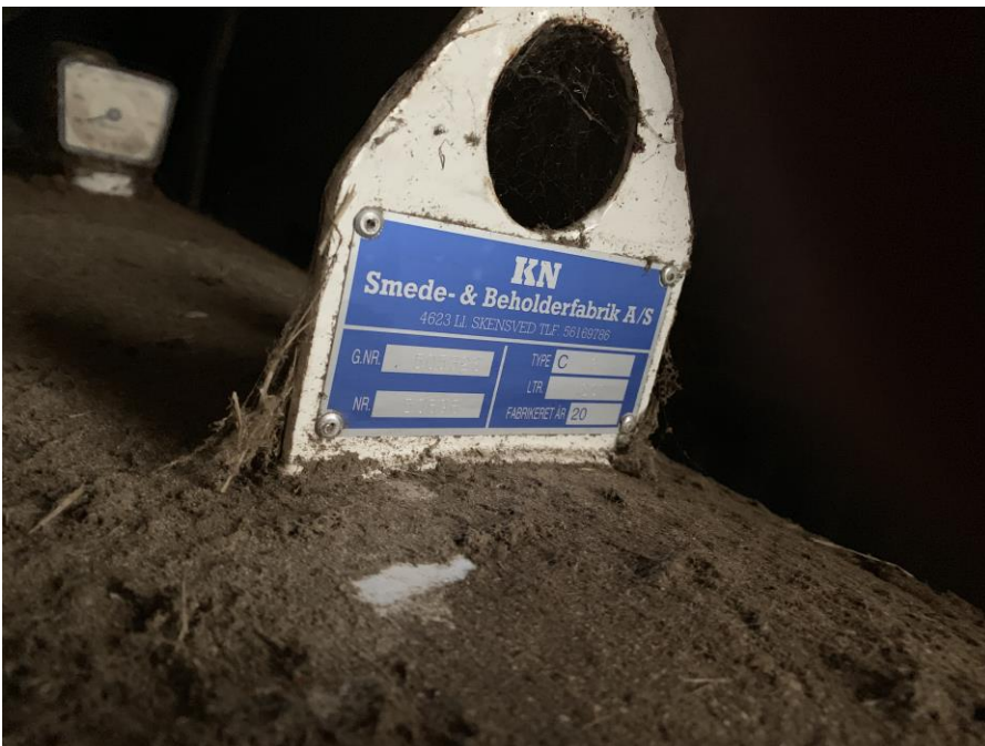
Mærkeplade olietank til traktordiesel, 1500 l årgang 2011