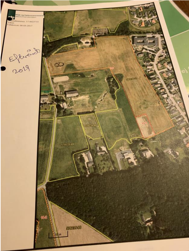
Markstak ved Sortmosevej 77